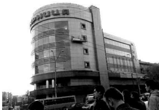
Торговий центр «Дарниця» на Ленінградській площі у Києві. 2009 р.