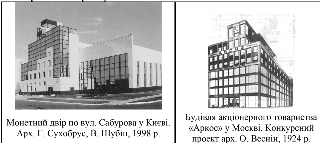
Таблиця. 1. Співставлення сучасних громадських об'єктів Києва із зразками новаторського напрямку

Наступні об'єкти, наведені в Таблиці 1, а саме: адміністративно-ділові будівлі у Києві (Монетний двір по вул. Сабурова та Банк по вул. 40-річчя жовтня), а також торговельний центр «Дарниця» на Ленінградській площі можуть слугувати прикладами, які навіть візуально свідчать про подібність вищезазначених ознак новаторського напрямку та архітектурно-композиційного образу сучасних будівель.