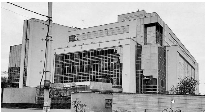
Банк по вул. 40-річчя жовтня у Києві, 2010р.