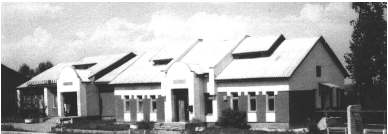
Рис. 3. Адмінбудинок, с.Шандра Миронівського району Київської області

Будівництво навіть першочергових об'єктів громадського обслуговування було підпорядковане пошуку своєрідного образу для кожного села. Такі споруди ставали архітектурними акцентами. З'явилися нестандартні об'єкти, які були яскравими прикладами творчого ставлення архітекторів до задач будівництва для переселенців. Це досягалося тим, що незважаючи на те, що у всіх селах об'єкти призначалося формувати за типовими проектами, індивідуальний підхід до реалізації дав змогу за екстремальних умов отримати