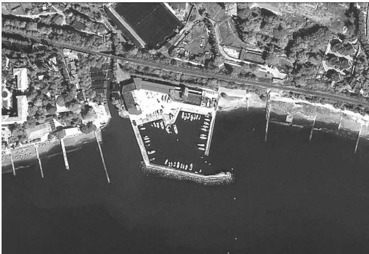
Рис. 1 гавань яхт-клубу

В залежності від типів обслуговуваних яхт їх можна розділити на акваторії для крейсерських яхт, та для спортивних швертботів. Для перших, причальні системи розташовуються так щоб максимально використати площу гавані і вмістити як можна більше яхт. Для спортивних швертботів, у яких немає навігаційного обладнання, необхідно створювати акваторії з хорошим оглядом причальних систем, для безпечного без навігаційного маневрування.