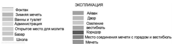
Рис1. Религиозно - просветительские центры Мечеть Имам г.Исфахан.

В планировании религиозно-просветительских многофункциональных центров ценным было, соединение двух функций – обучения и просвещения, что повышало результат их деятельности, и поэтому при мечетях, как правило, работали медресе , как медресе Агабабаган в г. Шираз.