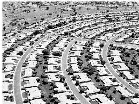
Рис. 1. Приклад соціально орієнтованого житлового утворення для людей похилого віку та маломобільних груп.