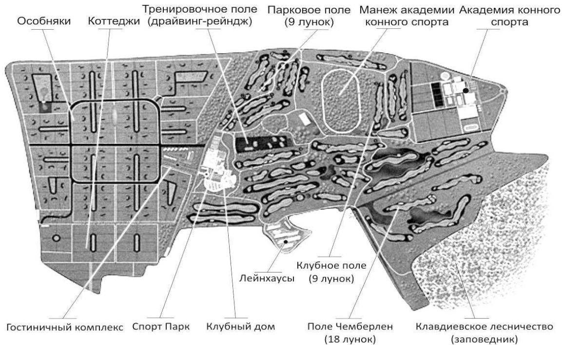
Рис. 1. Генеральный план гольф клуба «GolfStream», Украина, Киевская обл., с.Гавронщина. Площадь комплекса с инфраструктурой составляет 400 га [11].

Поля для гольфа занимают площадь от 25 до 140 га и требуют специального содержания (уход за газонами, дренаж почвы, орошение). Желательно, чтобы участок не пересекался общественными дорогами и другими коммуникациями.