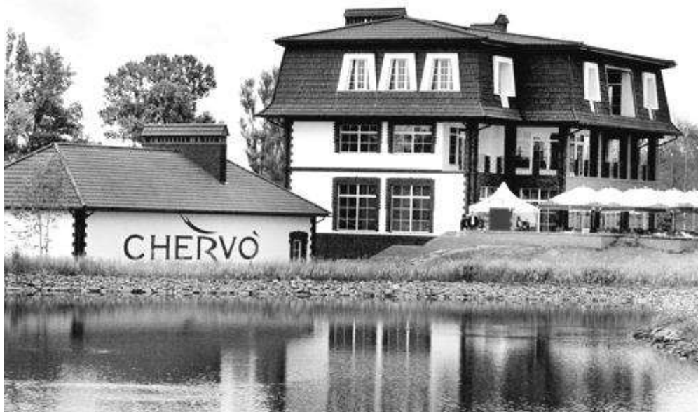
Рис. 4. Клубное здание «First Golf & Country Club». Украина, Луганская область, Славяносербский район, село Приветное [12].

В гольф клубах, кроме основного поля, создают также тренировочные площадки для отработки игроками первого удара, стойки и замахов, для преодоления банкеров (препятствий с песком), совершенствования финальных действий перед лункой. Таких тренировочных площадок может быть несколько: со стартовыми участками, прогонами разной длины и финальными участками с лунками. Они создаются обычно в стороне от гольфогового поля, в парке гольф клуба.