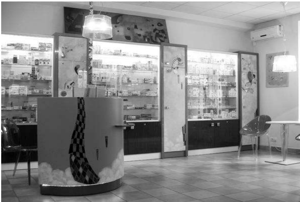
Рис.3. Інтер'єр аптеки в м. Києві. Автор проекту О. Фоміченко-Закуцька, художник О. Пилипчук, реалізація 2012 р