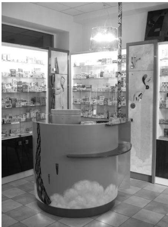
Рис.5. Фрагмент інтер'єру аптеки