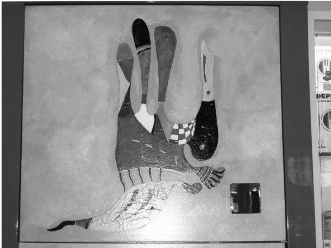
Рис.4. Фрагмент художнього розпису на фасаді шафи-пеналу (акрил, декупаж)