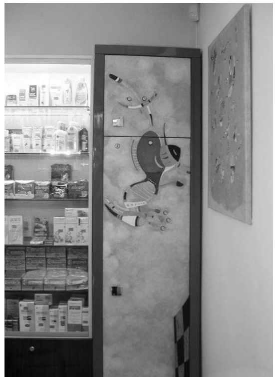
Рис.6. Фрагмент інтер'єру аптеки