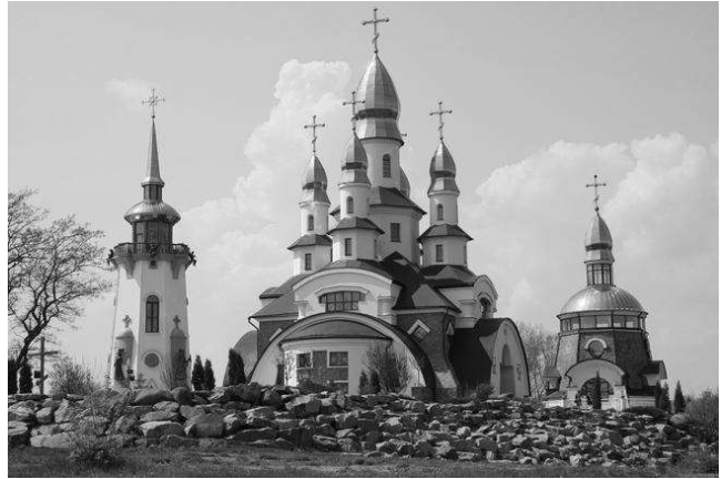
Рис. 2. Прийом цитування. Храмовий комплекс в с. Буки, Київської обл. Арх. Ю. Бабич

прийому в сучасному храмовуванні можуть бути: храмовий комплекс в с. Буки, Сквирського р-ну, Київської обл. (арх. Ю. Бабич) (рис. 2); храм Різдва Христового у Києві (арх. І. Авдєєв, Я. Дяченко); Марійський греко-католицький храмовий комплекс в Зарваниці, Тернопільської обл. та ін.