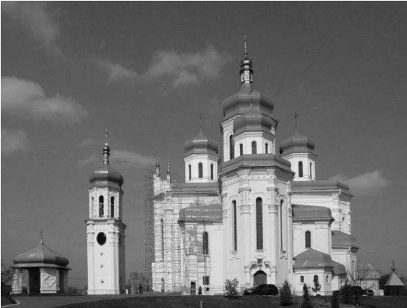
Рис. 1. Прийом історичної стилізації. Собор Святої Трійці, м. Київ. Арх. В. Гречина, І. Гречина.