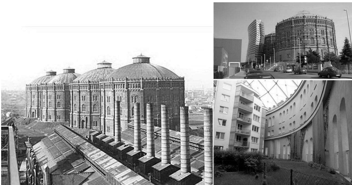
Рис.2 Комплекс газгольдерів у Відні.

Реконструкція архітектурних ансамблів в історичному центрі міста може проводитися з введенням необхідних просторових акцентів. При наявності цінних архітектурних об'єктів необхідно створити умови для їх виявлення в композиції, при монотонній забудові – знайти додаткові кошти архітектурної виразності. При проведенні реконструктивних заходів з подальшим формуванням лофт-житла доцільно виділити і зберегти найбільш цінні в естетичному плані будівлі, що дозволить розвинути позитивні індивідуальні риси і створити нову естетику промислової території на основі вже сформованого архітектурного ансамблю (рис. 2).