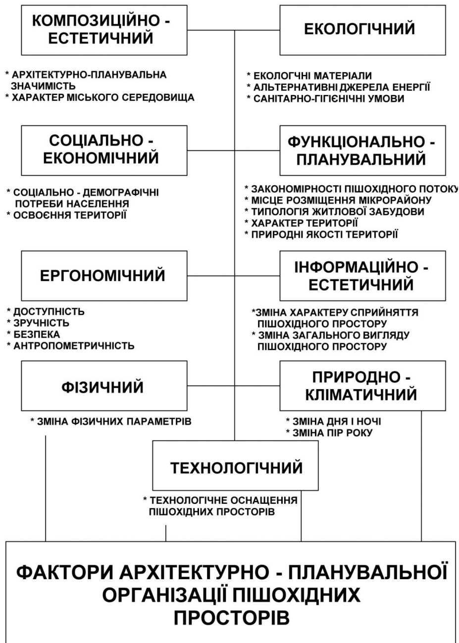
Рис.3 Фактори архітектурно – планувальної організації пішохідних просторів.

Розуміючи всю важливість даного питання, ми ставимо перед собою чітке завдання – змінити просторове відношення архітектурних об'єктів до навколишнього середовища, задавши пішохідним просторам нових умов сприйняття. Намагаючись закласти в концептуальну теоретичну модель стратегію подальшого розвитку з створенням повноцінного і різноманітного середовища, ми зможемо отримати середовище найвищого ґатунку, яке б задовольнило найвибагливішого споживача.