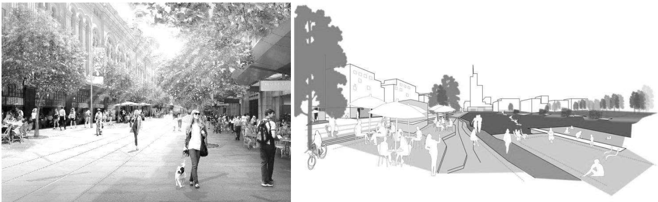
Рис.4 Організація пішохідних просторів. Проекти архітектурної компанії Gehl Architects.

Прикладом такого підходу може слугувати робота провідної архітектурної компанії Gehl Architect, яка займається розробкою інноваційних містобудівних проектів покращення міського середовища, виділяючи три групи факторів зручності міського пішохідного простору: безпека і захист (захист від автомобілів та несприятливих погодних умов, безпека від злочину), комфорт (зручність ходити, зручність стояти, візуальне сприйняття, місце відпочинку, можливість спілкуватись, можливість гратись та розважатись) та задоволення (масштаб, погода, позитивне сприйняття місця). Кожен з цих факторів тісно пов'язаний з переліком питань на які необхідно дати відповідь, задля усвідомлення стану проблеми.