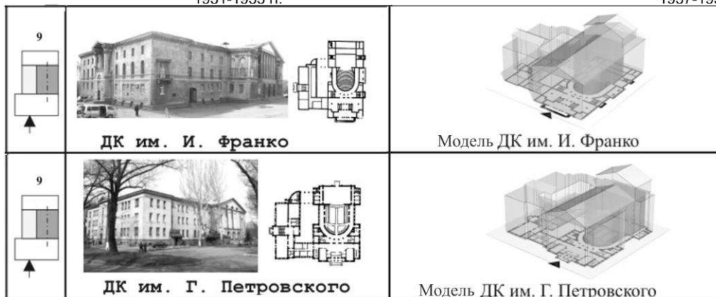
Рис. 5. Архитектура и композиционные модели клубных зданий г. Донецка

Выводы. Задачи градостроительства влияли на архитектуру клубных зданий и определялись характером отношений к организации пространства города. В соответствии с градостроительной теорией урбанистов на первом месте была композиционная организация пространства, здание фиксировало общественный центр поселка, выполняя ведущее идеологическое значение в населенном пункте. Пространственные средства архитектуры рационалистов – гладкие плоскости стен фасада в ДК им. И. Франко при реконструкции