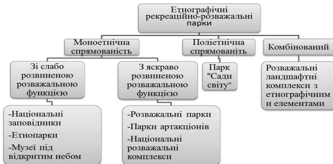
Рис.1 Класифікація етнічних рекреаційно-розважальних парків

Друга течія – поліетнічної спрямованості представляє так звані "сади світу" – це рекреаційно-розважальні парки, що включають в себе мікроландшафти з різних національностей країн світу. Прикладами є парк "Сади світу" в Марцані (Німеччина), пекінський Парк Світу, парк "Апельтерн" Нідерланди, національний парк світу Галіполійського півострова (Туреччина), в Печерському Парку під Києвом планується розробити 15-20 мікроландшафтів з різних країн світу. На основі проведеного дослідження виведена класифікація етнічних рекреаційно-розважальних парків наведена на рис.1.