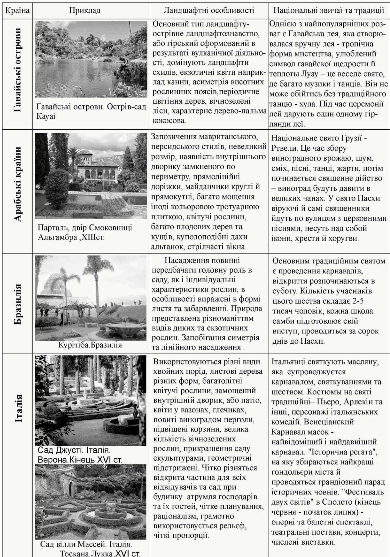
Таблиця 2 Етнічні та ландшафтні особливості рекреаційно-розважальних парків