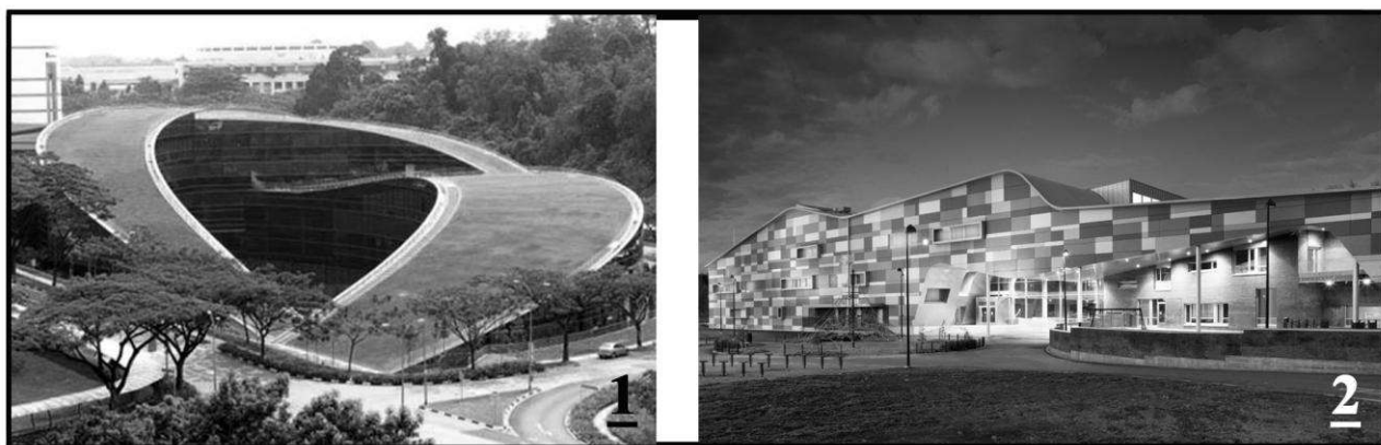
Мал.2.1. Школа мистецтв, дизайну і засобів масової інформації в Сингапурі;