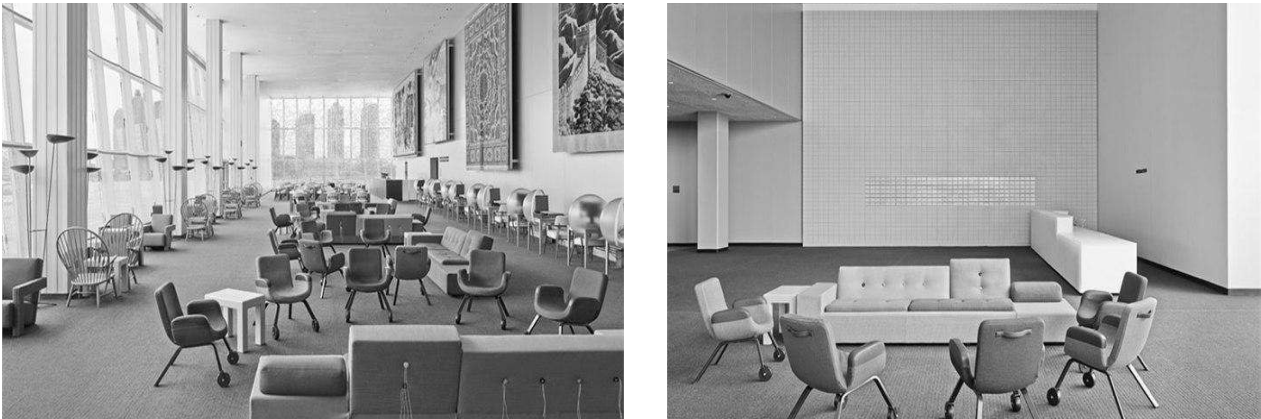
Рис.2 Лаундж-зона в офісі ООН, Нью-Йорк, 2013

Дизайнери Хелле Йонгеріус та Рему Коолхаасу виконали редизайн лаундж-зони офісу ООН в Нью-Йорку (рис.2).