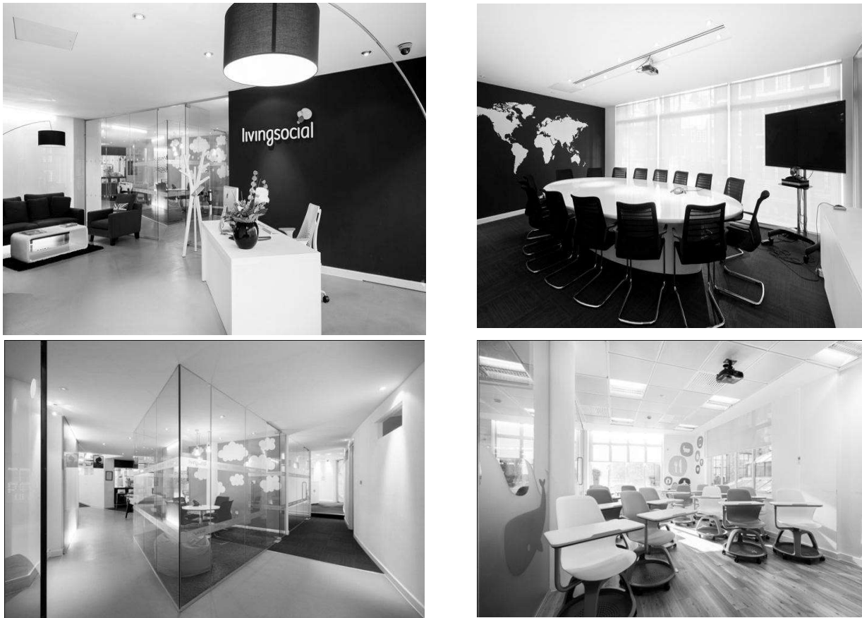
Рис.4 Офіс LivingSocial, Лондон

Негативним прикладом дизайн-вирішення в проектуванні простору окремих благодійної організації можуть слугувати офіс «Україна третього тисячоліття», який функціонує на даний момент на території нашої держави (рис. 5).