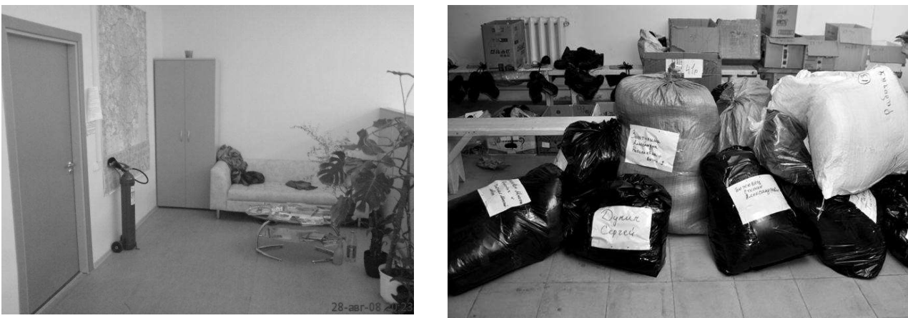
Рис. 5. Приклад офісу соціального спрямування, що потребує змін

Негативним прикладом дизайн-вирішення в проектуванні простору окремих благодійної організації можуть слугувати офіс «Україна третього тисячоліття», який функціонує на даний момент на території нашої держави (рис. 5).