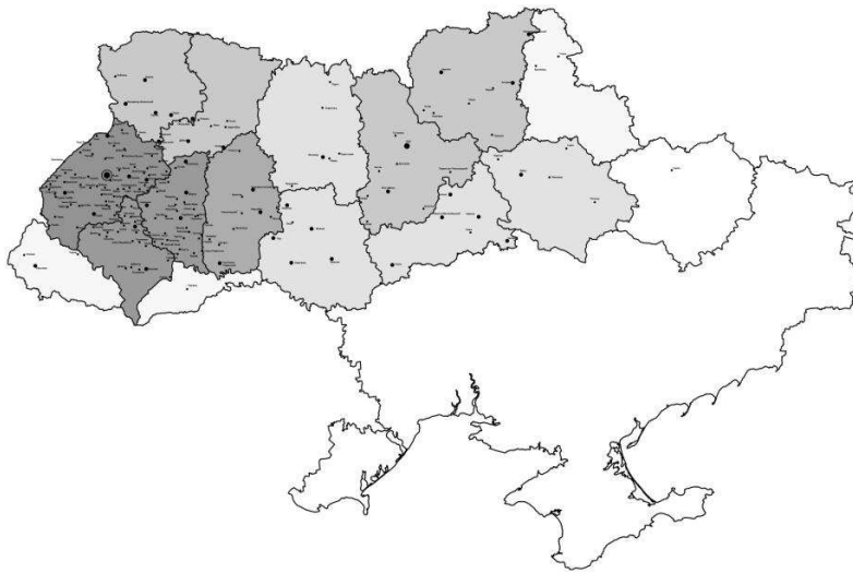
Рис. 1. Поширення міст-магдебургій на території України.

Справа в тому, що українські міста отримували «королівські привілеї» не внаслідок протестів громадян, а ці привілеї видавалися як дарчі грамоти громаді, з огляду на економічну вигоду та привабливість для переселенців. Власне цей субстрат «німецьких» правових норм та місцевих особливостей надали містам з магдебурзьким правом специфічного колориту, що відбивалося на всіх сферах життя тогочасного міста, у тому числі – його архітектурно-планувальній структурі. Особливо багато таких міст було в Західній та Правобережній Україні, що яскраво засвідчує рис. 1.