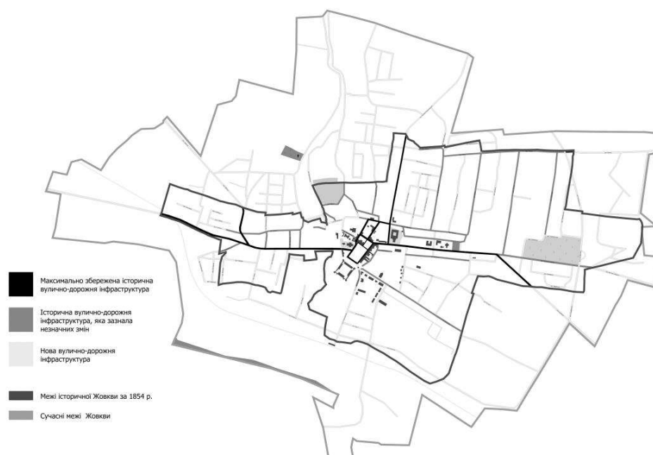
Рис. 2. Вулично-дорожня мережа старого і сучасного міста