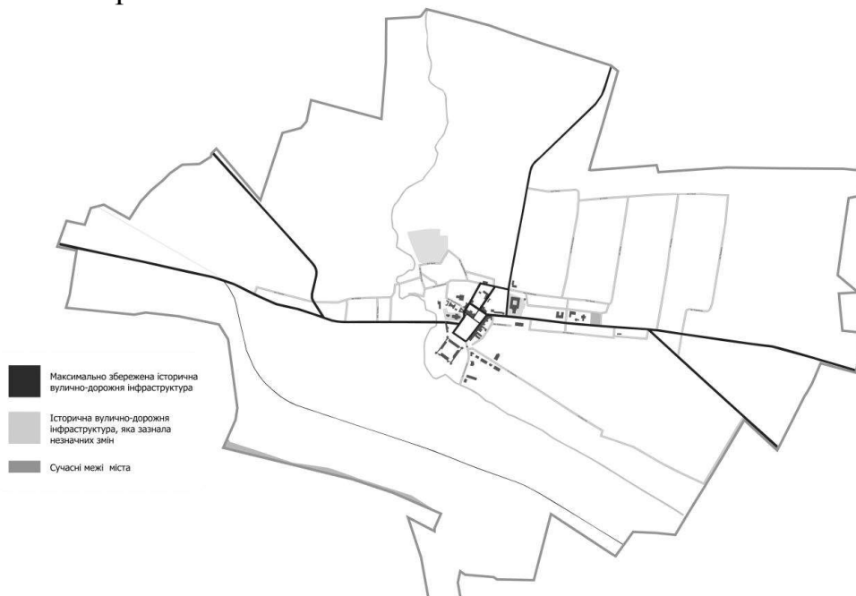
Рис. 3. Історичний каркас дорожньої мережі у м. Жовква

В основі дослідження міста провідну роль відігравав аналіз конкретної вилиці і подальша загальна їх структуризація, що дозволило в результаті сформуванню збереженої історичної вулично-дорожньої мережі міста Жовкви, представлений на рис. 3.