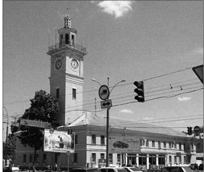
Рис. 3. Сучасний вигляд пожежного депо на розі вулиць Фрунзе і Шевченка. Світлина 2009 року.

Перспективи подальших розвідок у даному напрямку. Подальші розвідки планується присвятити виявленню інших містобудівних домінант Полтави середини ХХ сторіччя з обов'язковим визначенням їх авторів.