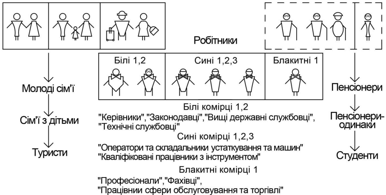
Рис.1. Потенційні споживачі житла довготривалого перебування

То що ж собою являє житло довготривалого перебування? Гіпотеза така: Житло довготривалого перебування – це житловий будинок чи житлове приміщення, розраховане на проживання людей терміном від 1 – 5 років. Цей часовий термін визначається способом життя людей. Житло має всі функціональні зони, але деякі з них скорочені або навпаки, більш розвинуті, в силу потреб людей, на яких розраховане це житло. Від того, які соціальні групи населення виступають замовником довготривалого житла, які потреби мають і які висувують вимоги до такого житла, залежить розмір та розвинутість функціональних зон.