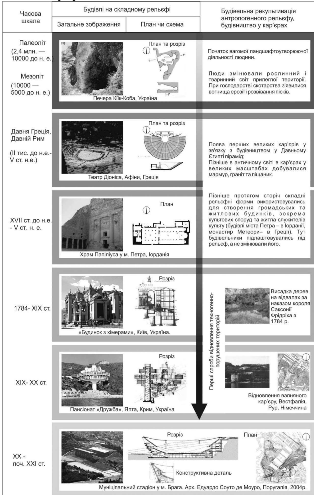
Рис.1 Історичні передумови будівництва будівель на території кар'єрів

Висновок. Приведено історичні передумови до поєднання наприкінці ХХ століття процесів рекультивації кар'єрів та будівництва на складному рельєфі. Дані процеси перетинаються утворюючи новий напрямок формування будівель в умовах складного штучного рельєфу, тобто на території рекультивованих кар'єрів.