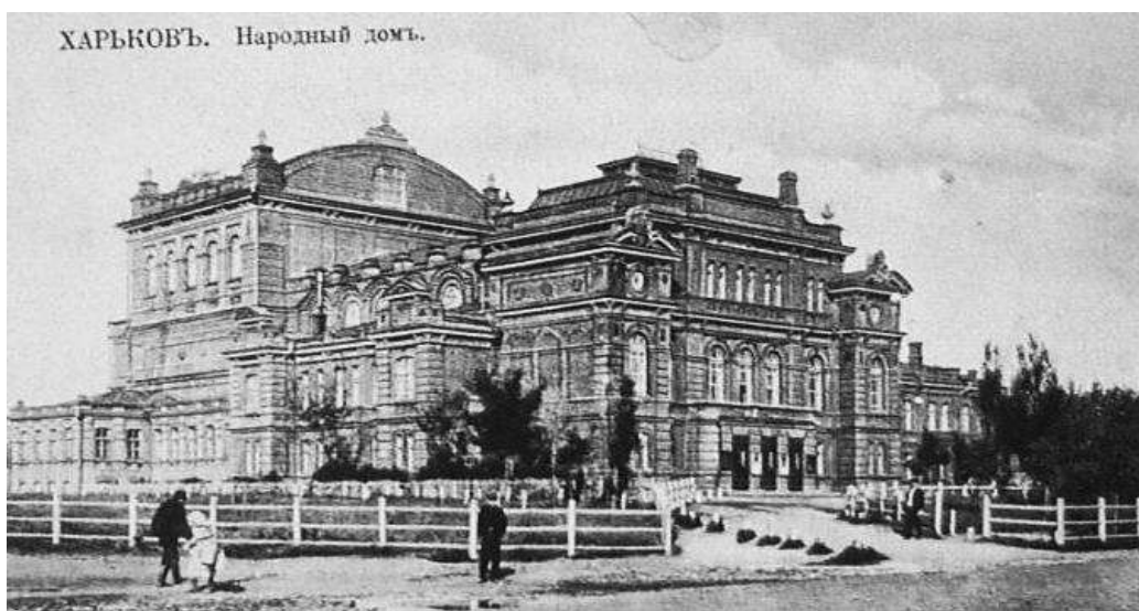
Рис.1. Народний Дім, Харків, поч. XX ст., арх. А. А. Венсан

Вважається, що вперше позашкільна форма роботи з дітьми з'явилася в 30-ті роки XVIII століття, коли в Шляхетському кадетському корпусі в Санкт-Петербурзі був відкритий гурток з літератури для занять у вільний час. Наприкінці XIX ст. стали відкриватися перші дитячі клуби в народних домах (рис. 1). В дореволюційній Росії народні дома були загальнодоступними культурно-просвітницькими закладами, в яких дорослі отримували вечірню освіту, а діти – позашкільну освіту. Дитячі клуби нагадували багато в чому сучасні гуртки для дітей. На початку XX ст. також стали з'являтися перші позашкільні заклади, які займалися вихованням: діти відвідували музеї, концерти, театри та інші культурні заклади. Нерідко для дітей організовували спеціальні курси з малювання, літератури та інших предметів.