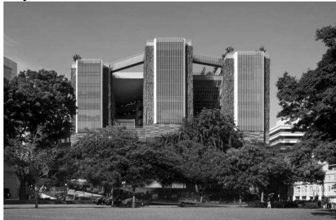
Рис. 3. Школа мистецтв в Сінгапурі, 2009, арх. група WONA

Висновок. Проаналізувавши історію виникнення закладів позашкільної освіти, можна сказати, що протягом свого розвитку їх архітектурна форма, оформлення внутрішнього простору, мета, яку ставили перед собою заклади, постійно змінювались. Історію цих установ можна поділити на три періоди: