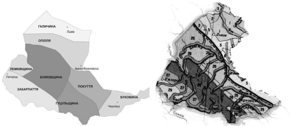
Рис.3. Етнографічне районування та ландшафт Українських Карпат.

народної архітектури з природою перш за все полягає у раціональному пристосуванні до кліматичних та географічних особливостей.