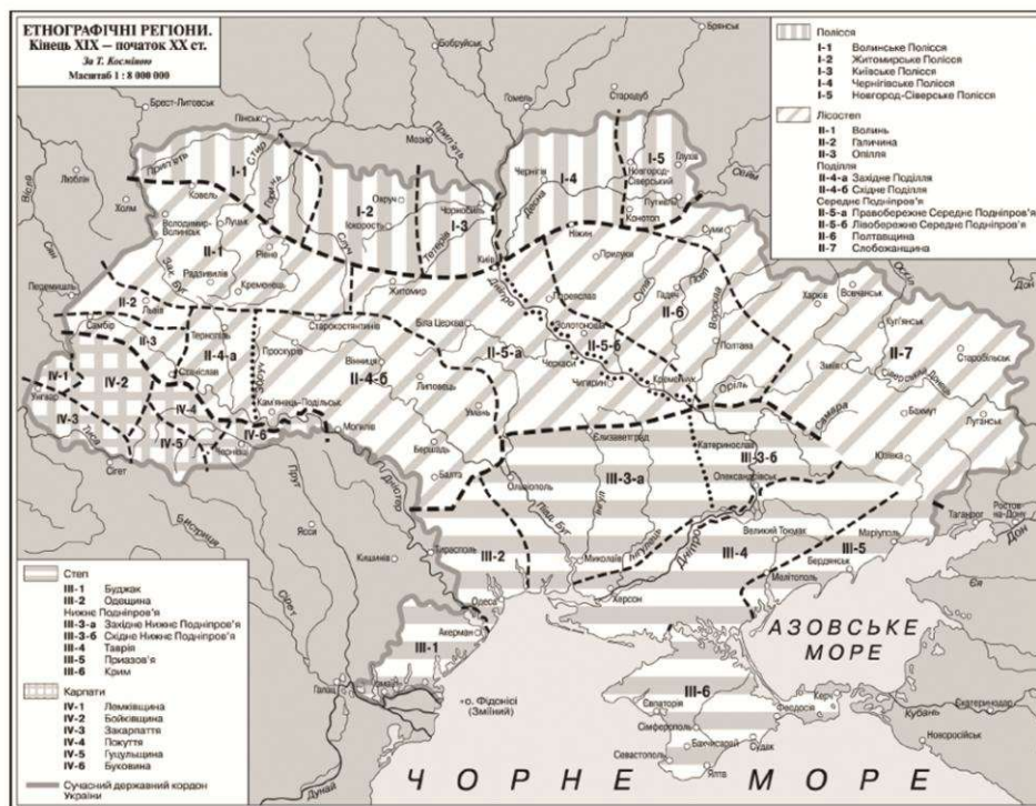
Рис.1 Етнографічні регіони України за Т.Косміною

За природно-кліматичними умовами Г. Логвин визначає чотири великі зони – Полісся, Лісостеп, Степ, гірські та передгірські райони, в яких сформувалося більше десяти шкіл народного храмовбудування. За сучасними дослідженнями Я. Тараса на території України можна виділити двадцять шкіл народної архітектури.[9,с.391] Переважна більшість цих шкіл сконцентрована в передгірських та гірських районах Українських Карпат. Загалом, внаслідок активного переселення людей із центрально-східних земель Київської Русі у XIII ст., традиційна архітектура Карпат відзначена рисами притаманними для всього українського народу. Через специфіку ландшафту, що певний час обмежував зовнішній вплив на розвиток культури та побуту Карпатських поселень, тут збереглися первісні традиції храмовбудування. Внаслідок відокремленого розвитку місцевої культури в практично закритих місцевостях в умовах складного рельєфу, розподілу гірськими хребтами та річками в різних кліматичних умовах поступово сформувались різні будівельні традиції. Традиційні прийоми архітектурного формотворення, характерні для певних етнографічних районів України, утворюють школи народного храмовбудування.