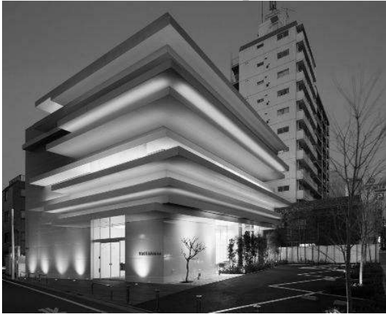
Рис. 2. Sugamo Шінкін банку в Токіо

каменем HI-MAX білого кольору, на які нанесені великі портрети знаменитих діячів мистецтва, які проживали в Цюріху (рис. 3).