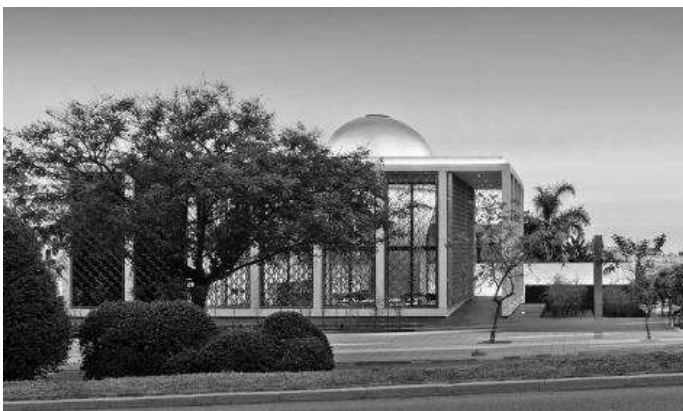
Рис. 4. Марокканський банк зовнішньої торгівлі (BMCE)

Дизайнер Роберт Майкут запропонував використовувати при оформленні РКО Bank Polski фірмові кольори цієї організації - чорний, білий і золотий. Концепція проекту полягає в тому, щоб поєднати естетичність з математичною точністю, подібно до того, як в роботі банку повинні поєднуватися життєвий досвід і правильний розрахунок (рис. 5).