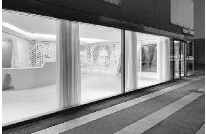
Рис. 3. Райффайзен Банк у Цюріху

Будівля Марокканського банку зовнішньої торгівлі (BMCE) - перший африканський проект відомої компанії Foster & Partners. Великі вікна, закриті ажурними ґратами з нержавіючої сталі з низьким вмістом заліза, - це не тільки ефектний елемент дизайну, але і вдале рішення для спекотного клімату. Так забезпечується широкий доступ денного світла, причому температура в приміщенні залишається комфортною (рис. 4).