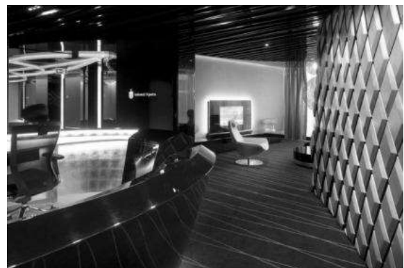
Рис. 5. РКО Bank Polski у Варшаві