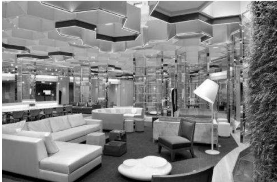
Рис. 1. Банк BNP Paribas у Парижі

Яскравий дизайн Sugamo Токіо Шінкін банку відповідає девізу компанії: «Ми отримуємо задоволення, обслуговуючи щасливих клієнтів» . Французький архітектор Еммануель Муру вирішив прикрасити фасад будівлі Дванадцяти різнокольоровими горизонтальні пластами різних розмірів (рис. 2), які всю ніч підсвічуються.