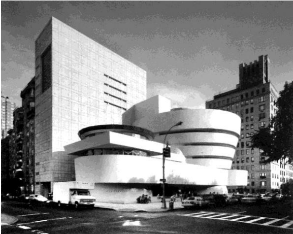
Музей С.Гуггенхайма у Нью-Йорку, 1959р., Gwathmey Siegel & Associates Architects