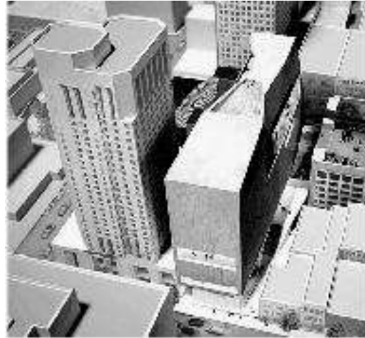
Музей сучасного мистецтва Сан-Франциско, США Snohetta

Розширення музею Джосліна виконано з урахуванням архітектурно – художньої естетики основної будівлі та її розширення (“погодження естетики основної будівлі та її розширення”). Нове крило виконане з урахуванням пропорцій, оздоблення фасадів здійснено з використанням аналогічних матеріалів існуючого музею.