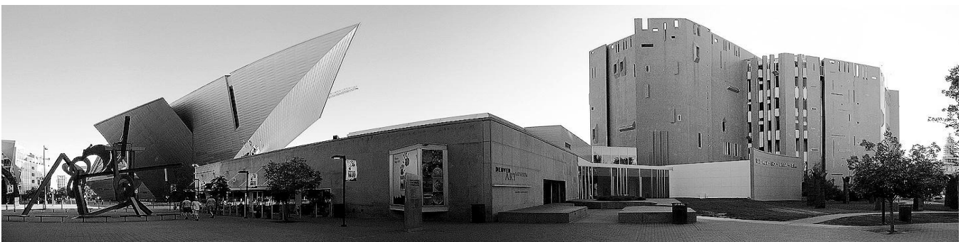
Розширення Музею мистецтв, Денвер, США, 2006р., арх. Д.Лібескінд

Музей в місті Денвер зазнав двох розширень, останнє з яких належить арх. Д.Лібескінду. Якщо перше враховувало основні елементи, щоб не протистояти основній будівлі, то останнє зовсім не враховує існуючі дві будівлі і контрастує з існуючими.