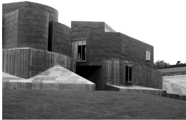
Розширення музею Толедо, США, 2007р., арх. К.Седзіма, Ryue Nishizawa