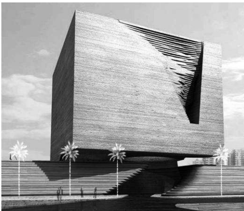
Художній музей NURAGIC, Італія, Кал’ярі, Сардинія, 2007 р. арх. Ф. Праті та MDU

На кінець ХХст. в проєктуванні музеїв склалось дві течії, що сповідують експресивно – деструктивний напрямок (арх. Ф.Гері, Д.Лібескінд, З.Хадід) та мінімалістський, що надавав перевагу функціональній організації (арх. Людвіг Міс ван дер Рое, Т.Андо, А.Аалто, Й.Танігучі) [3]. Аналізуючи специфіку цих напрямків слід відзначити право на існування обох течій, що забезпечують розвиток та поступ архітектури художніх музеїв.