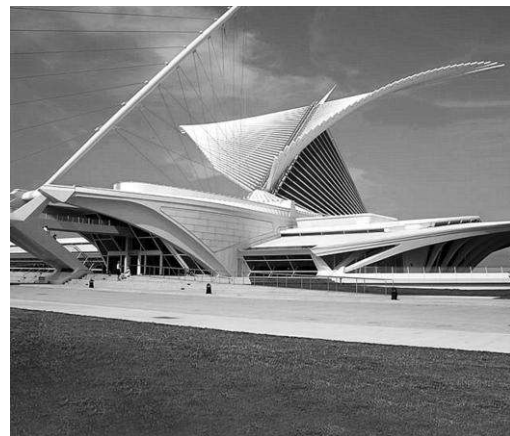
Розширення художнього музею США, Мілуокі, 2001 р. арх. С. Калатрава