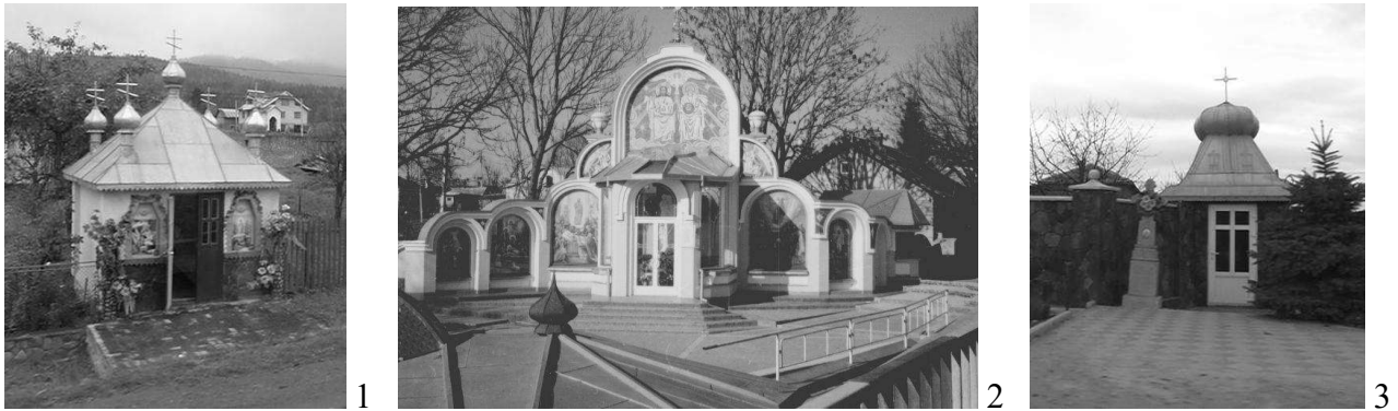
Рис. 4. «Каплички» у структурі садиби: 1. Івано-Франківська обл., 2. Тернопільська обл., 3. Чернівецька обл.

Останнім часом на садибній ділянці появляються нові форми – відновлюють колишні або зводять нові пам'ятні знаки релігійного характеру: хрести, скульптури («фігури») Матері Божої, ікони, невеликі приватні церкви, каплички для молитви, а в деяких випадках і каплички присвячені пам'яті померлих (рис. 4-7.1).