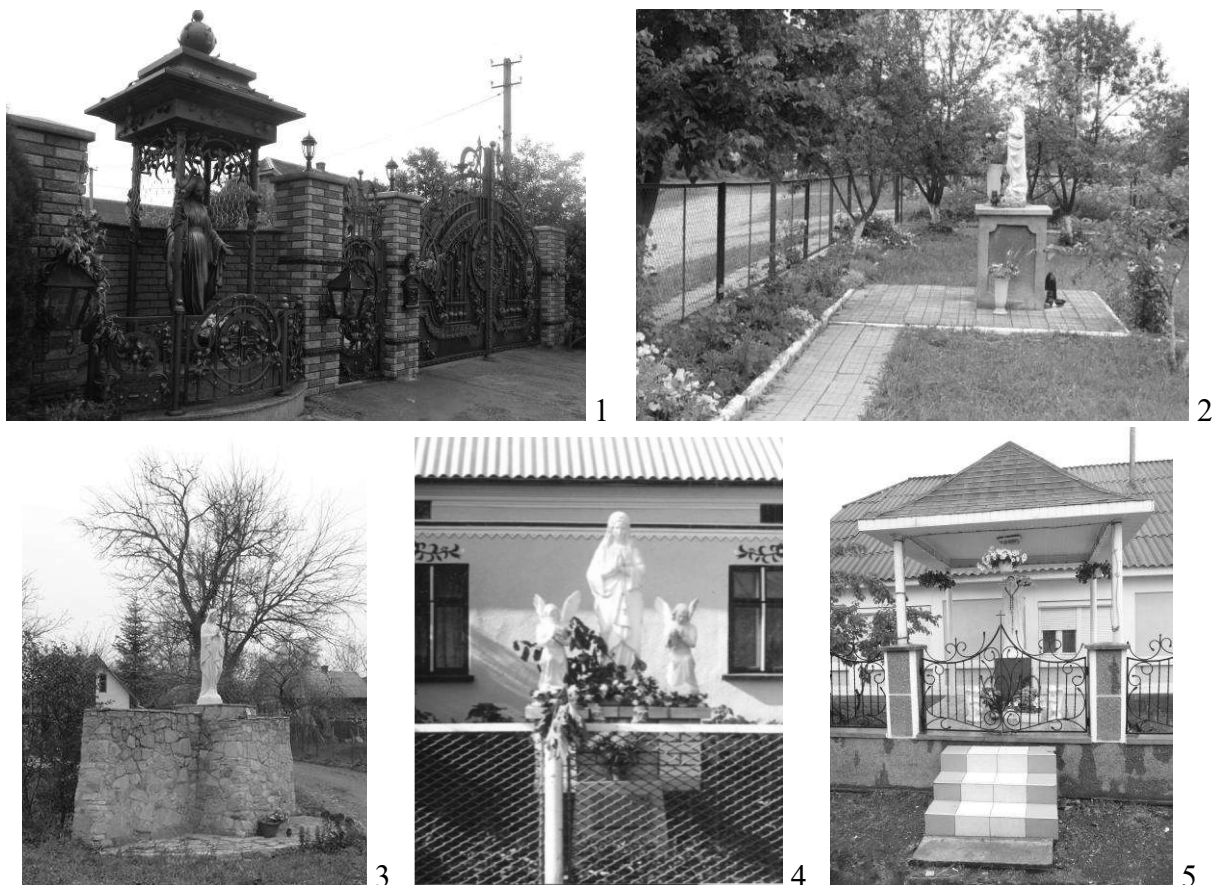
Рис. 5. «Фігури» у структурі садиби: 1. Івано-Франківська обл., 2. Львівська обл., 3. Чернівецька обл., 4. Тернопільська обл., 5. Закарпатська обл.

Оздоблення садиби елементами релігійної символіки відбувається досить стихійно і залежить від смаку та побажання господаря садиби. Сакральні