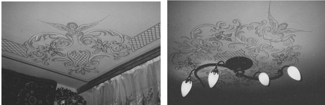
Рис. 2. Розписи стелі вітальні на релігійну тематику, Тернопільська обл.

У житлових кімнатах розписують стіни та стелі на релігійну тематику, обладнують спеціальні полички та встановлюють підставки для релігійної символіки (рис.2). Заможні власники осель організують окремі приміщення для молитви у структурі житлового будинку. На будинках часто влаштовують ніші для сакральної скульптури (рис.3).