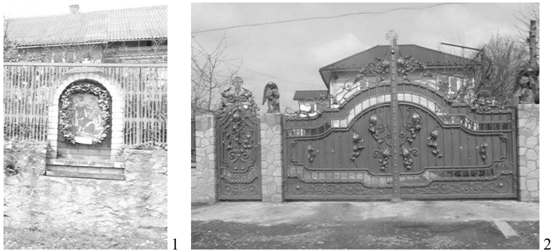
Рис. 7. 1. «Ікона» у структурі огорожі садиби, Тернопільська обл., 2. «ангели та хрести» як елементи оздоблення хвіртки та воріт, Чернівецька обл.

Дослідження, проведені на основі зібраних матеріалів під час експедицій у селах Західного регіону України, показали, що релігія має вплив на формування сучасної садибної житлової забудови. Проявом релігійності у структурі житлового будинку та присадибної ділянки є: