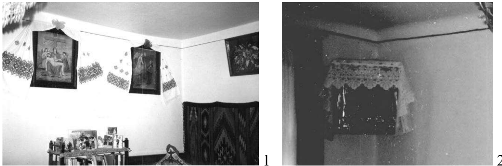
Рис. 1. 1. «Ікони», 2. «Божниця» на стіні у житловій кімнаті, Тернопільська обл.

яка нагадує постійну Божу присутність в хаті. В інших кімнатах ікони теж розташовані на стінах чи по кутах. За звичаєм гість, заходячи до хати, перше схиляється перед іконами, а вже після промовляє до господаря [3,8].