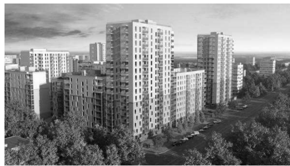
Рис.4. Квартал «Сандей», Красносільський район, м. Санкт-Петербург, Росія [3]