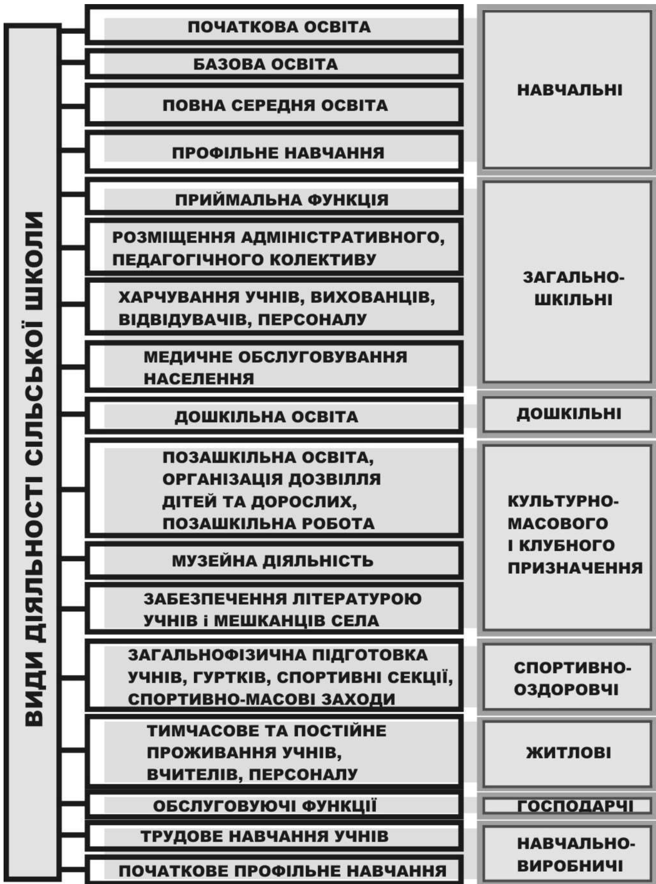
Рис.1 Види діяльності сільського загальноосвітнього навчального закладу