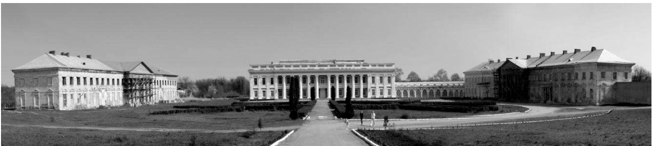
Рис. 4. Палац Потоцьких

Після переїзду Потоцького до Тульчина місто стало предметом великої турботи графа, який прагнув повернути йому колишнє значення. З цією метою він розширив свої маєтки, залишивши господарсько-адміністративним центром тільки тульчинський двір. Згодом був споруджений Тульчинський палац в 1782-му за проектом архітектора Лакруа як єдиний ансамбль, до складу якого входили, окрім головного палацу, два бічні флігелі, галереї (оранжереї), турецька лазня, театр, манеж, стайні, службові й житлові приміщення. Частина споруд садиби була звернена фасадами на вулицю, тобто входила в систему забудови міста. Споруда є однією з найцікавіших пам'яток періоду класицизму. Ансамбль оточував парк, що мав назву «Хороше», закладений у 1782 році за проектом архітектора П'єра Ленро.