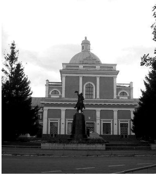
Рис. 5. Домініканський костел

1779 р. збудована Успенська церква, яка також орієнтована на палацовий комплекс Потоцького.