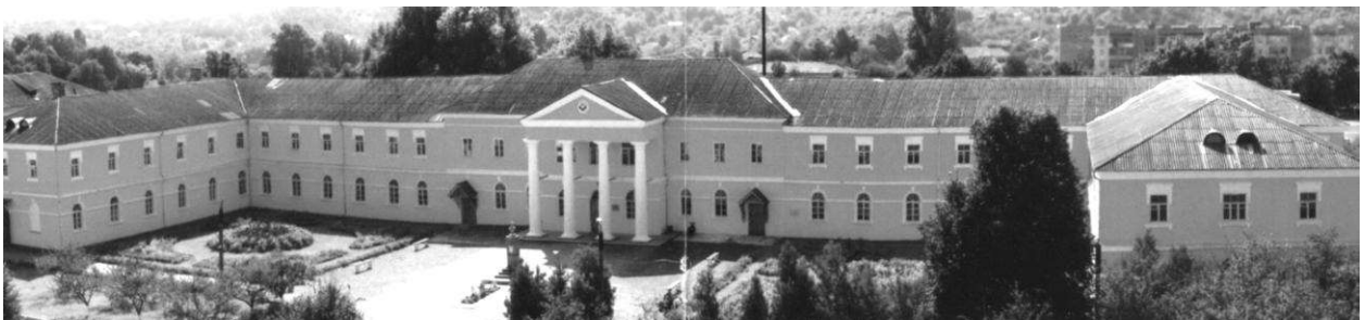
Рис.7. Казарми кінної армії (малий палац Потоцького)

Третій період припадає на 1790-1830 рр. У 1793 Тульчин стає повітовим містом Брацлавського намісництва, з 1797 року – Подільської губернії. З 1796 року в ньому проживає командуючий Південно-Західною армією російський полководець О.В. Суворову Саме тут він написав знамениту працю «Наука перемагати». В 1818 р.-розпочато декабристський рух, полковник П.І. Пестель організує Тульчинську управу – філію «Союзу благоденства», яка проголошує себе Південним товариством. Основними архітектурними пам'ятками цього періоду стали: 1. Казарми 2-ої Російської кінної армії, 2. Будинок, в якому жив Пестель П.І. 3. Будинок дворянського зібрання (будинок «декабристів»).