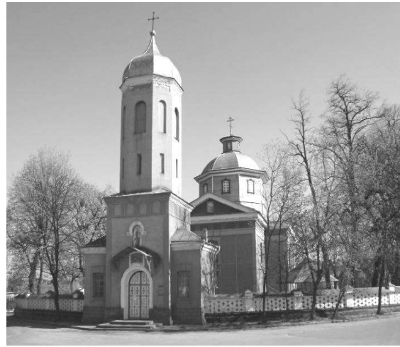
Рис. 6. Успенська церква

Третій період припадає на 1790-1830 рр. У 1793 Тульчин стає повітовим містом Брацлавського намісництва, з 1797 року – Подільської губернії. З 1796 року в ньому проживає командуючий Південно-Західною армією російський полководець О.В. Суворову Саме тут він написав знамениту працю «Наука перемагати». В 1818 р.-розпочато декабристський рух, полковник П.І. Пестель організує Тульчинську управу – філію «Союзу благоденства», яка проголошує себе Південним товариством. Основними архітектурними пам'ятками цього періоду стали: 1. Казарми 2-ої Російської кінної армії, 2. Будинок, в якому жив Пестель П.І. 3. Будинок дворянського зібрання (будинок «декабристів»).