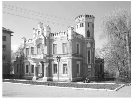
Рис. 9. Особняк Глікхера (1905р.)

П'ятий період містобудівного розвитку відбувається наприкінці ХІХ – початку ХХ ст. У Тульчині вже налічувалося близько 40 дрібних підприємств – цегельні, шкіряні й свічкові заводи, паровий і водяний млини, цукроварня, крупорушка, макаронна, тютюнова і каретна фабрики, вовночесалка, пивоварня і медоварня, завод штучних мінеральних вод. Місто мало понад чотириста невеликих крамниць, лавок, шинків, корчем. Діяли банківська і нотаріальна контори, готель, 12 заїжджих дворів.