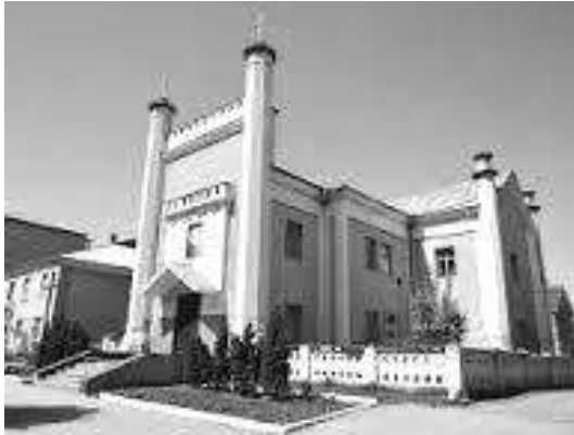
Рис. 8. костел Св. Станіслава.

Інтенсивно розвивалися кустарні промисли, було побудовано цукроварню, два шкіряні заводи, водяний млин, дві тютюнові фабрики, екіпажні майстерні. Протягом ХІХ ст. Тульчин зберігав статус одного з найбільших торгівельних центрів Південно-Західного краю. Споруджено ще один римсько-католицький костел в ім'я Св. Станіслава.