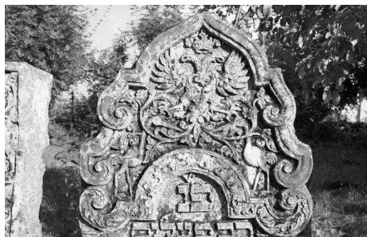
Рис. 2, 3. Старе єврейське кладовище.