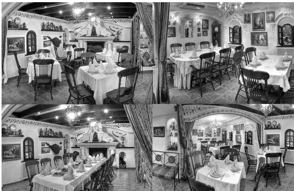
Рисунок 2. Інтер'єр ресторану «Хатинка» м. Київ, 2009 рік, майстер: Галина Назаренко.

Розкриваючи основні механізми застосування петриківського розпису в сучасних інтер'єрах громадських будинків і споруд варто відзначити сучасне оформлення ресторану «Хатинка». Весь інтер'єр «Хатинка» просякнутий і відтворений в кращих традиціях української хати. Тут є навіть невід'ємна частина старовинного будинку – справжня піч, яка прикрашена петриківським розписом, та прядка з веретеном – обов'язкове ноу-хау українського дому в старовину, рис. 2.