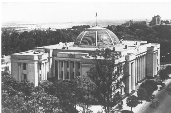
Рис. 3 Будинок Ради