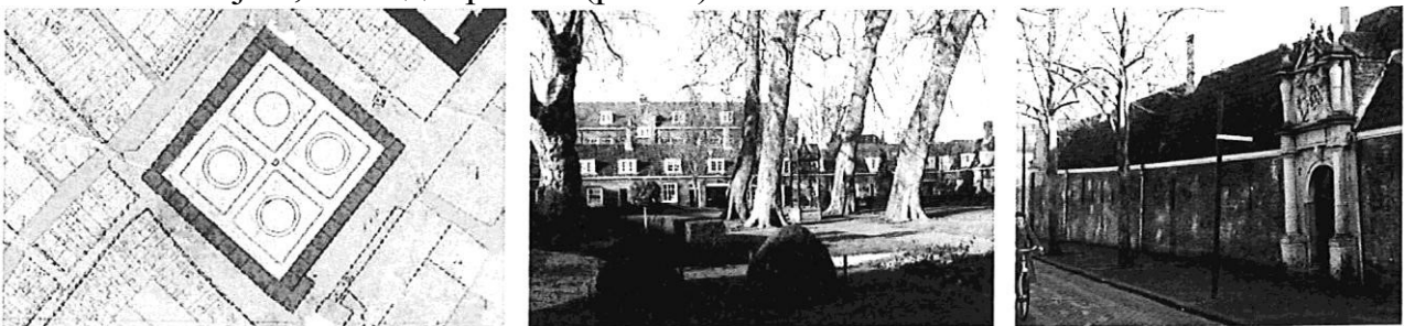
Рис. 1. Maarten Arendshofje Dordrecht, побудоване у 1625 році. Справа наліво: Розташування в структурі кварталу, вид із внутрішнього двору, вид з вулиці.[4]

В якості прикладу вже існуючих ЗЛЛ, для яких внутрішній двір є характерною типотворюючою ознакою, можна привести голландський тип будівель, який виник із традиційних робітничих домів для літніх одиноких жінок - так звані "hofje", або «дворики» (рис. 1).