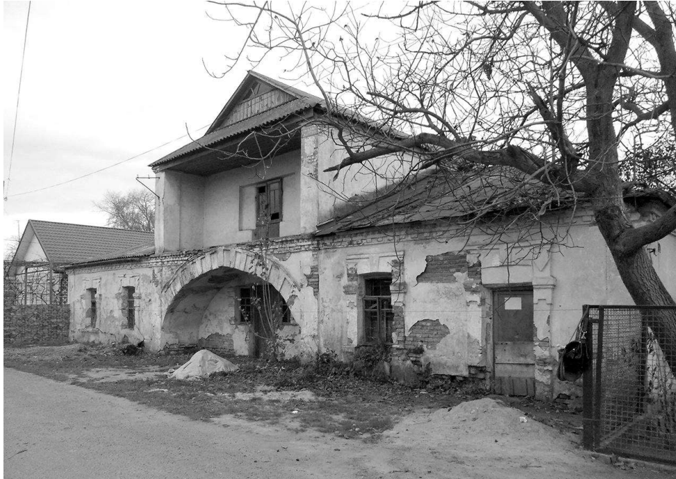
Рис. 2. м. Старокостянтинів. Збережений заїзд кінця XVIII ст.