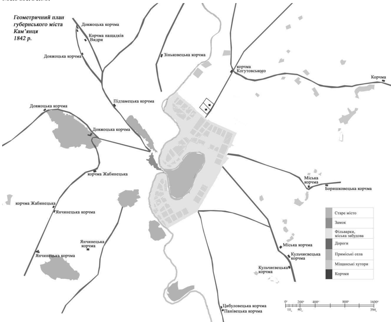
Рис. 1. Геометричний план губернського м. Кам'янець-Подільського 1842 р. з 21-ю корчмою на передмістях.

Для туристичного огляду можна запропонувати два старовинних парки з деревами місцевих порід, три музеї (історико-краєзнавчий музей, музей історії суконної фабрики, музей історії освіти Дунаєвеччини), палац Красінських, який в різні часи належав Потоцьким, Станіславським, Конєцпольським та іншим магнатам.