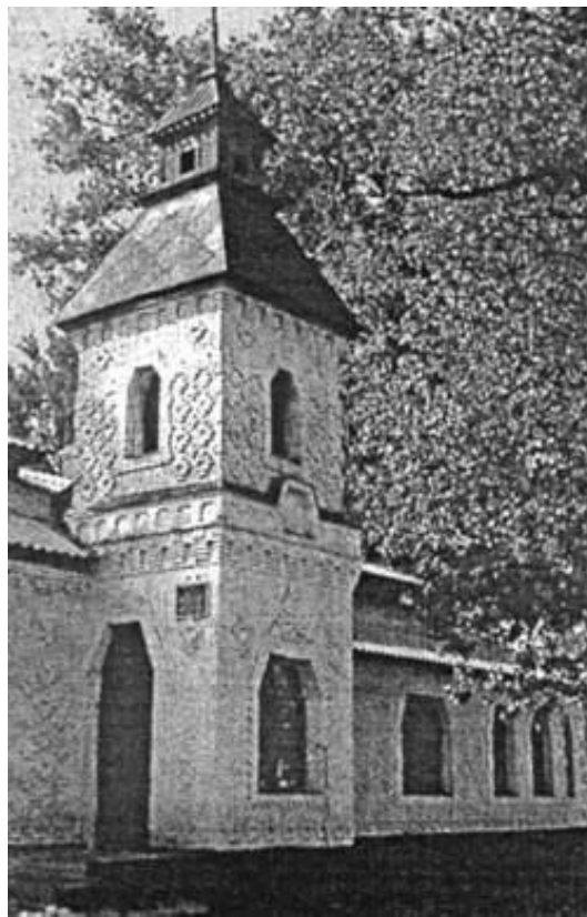
Рисунок 2 – Будинок школи в с. Западинці Лохвицького району. Сучасний вигляд

Будівлі земських шкіл мали декілька вхідних отворів (головні та допоміжні). Головний вхід завжди був підкреслений двоповерховою вежею, що також сполучала між собою два блоки: учбовий блок та блок житлових і допоміжних приміщень. В одно- та двокласних школах вежа підкреслювала асиметричність архітектурно-композиційного вирішення будівлі, а в три- та чотирикласних школах, де панувала симетрія, – веж було дві. Чотирикласні школи мали найбільш пластичне вирішення головного фасаду завдяки трьом висунутим вперед об'ємам, середній з яких фланкували дві вежі. Ці вежі були перекриті наметовим дахом зі шпилем (рис. 2). Портали мали трапецевидну шестикутну форму з обрамленням.