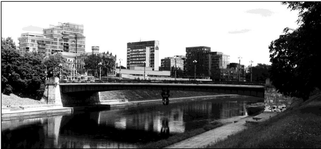
Рис. 2. Зелений міст у Вільнюсі, 1948 – 1952 рр. (фото автора, 2015 р.) Загальний вигляд

Сучасний міст був зведений у 1948–1952 рр. за проектом ленінградського інституту «Проектстальконструкція» (головний інженер Є. Попов) силами радянських воєнно-інженерних військ Прибалтійського військового округу. Тоді міст був названий у честь генерала І. Черняховського (рис. 2). З інженерного аспекту міст однопролітний з криволінійними обрисами нижнього поясу. Довжина мосту – 102,9 м, ширина – 24 м, висота над рівнем води – 15 м.