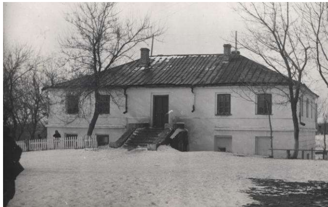
Рис.2. Жовтий палац. Фото 1976 р.

Під час володіння маєтком Пшилуськими, як вже згадувалося, й відноситься його розквіт, а саме будується садиба та розбивається парк. Первісно головною спорудою був так званий "жовтий палац" (Рис. 2).