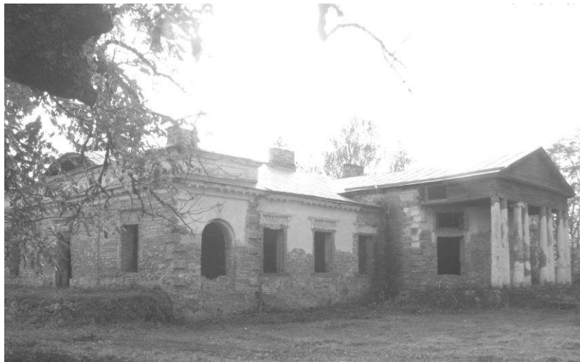
Рис. 5. Парковий фасад головного палацу. Фото 2000-х р.р.

Фасади п'ятидільні, з трьома ризалітами. На головному фасаді центральний ризаліт являє собою шестиколонний портик іонічного ордеру, який піднятий на високий стилобат та завершається трикутним фронтоном. Бічні ризаліти на головному фасаді закріплені кутовим рустом та архітектурно підсилені аттиками, на площині яких розташовані ліпні гірлянди. Бічні ризаліти підкреслені плоскими віконними нішами. [2] Парковий фасад відповідає головному, являючи собою восьмиколонний портик (Рис.5).