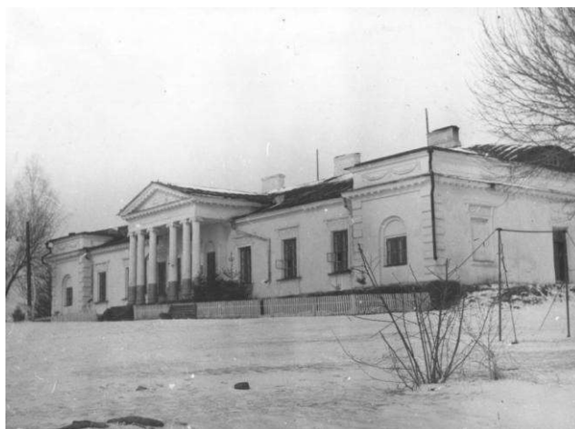
Рис. 3. Головний новий палац. Фото 1976 р.

А в період володіння нападівськими землями Яном Пшилуським припадає активна розбудова садиби, зокрема близько 1820 року був побудований палац у стилі зрілого класицизму, який і став головною будівлею, а "жовтий" палац почав використовуватися в якості флігеля (Рис. 3).