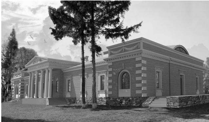
Рис. 10. Зображення відновленого палацу, розроблене архітекторами інституту «УкрНДПроектреставрація» [8]

залученням іноземних інвестицій, спонсорських коштів, налагоджувала контакти із ЮНЕСКО тощо. Адже лише на садибу у селі Нападівка потрібно, за попередніми підрахунками, вісім мільйонів гривень.