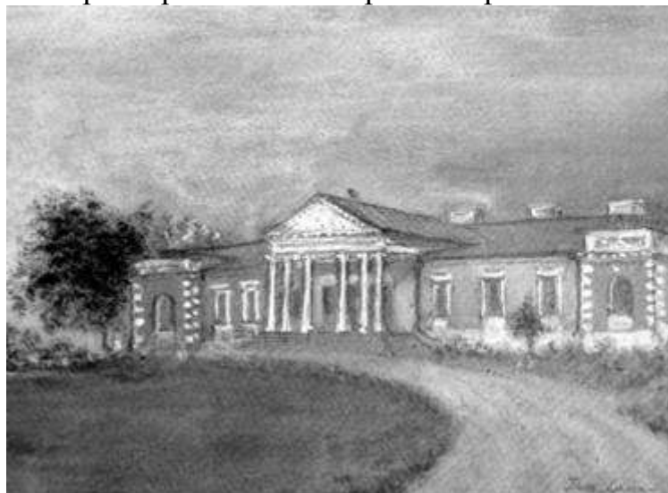
Рис. 7. Малюнок Тора Ланге. Головний палац.

Проектні, інженерно-будівельні, художні та садові роботи виконувала Київська губернська креслярня на чолі з архітектором А.Меленським. [7]