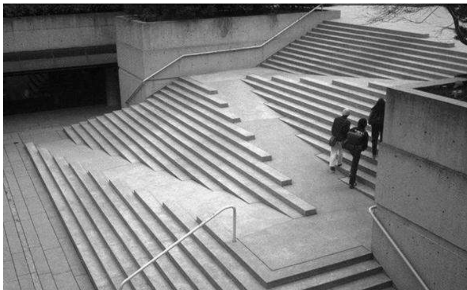
Рис.3. Рішення пандусів у школі «Hazelwood»