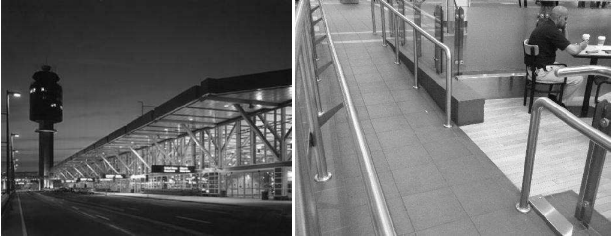
Рис.1. Аеропорт Ванкувера, Канада – вигляд зовні та пандус в інтер'єрі