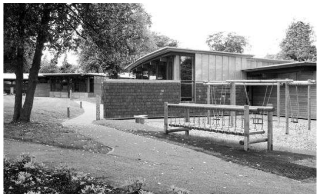
Рис.2. Школа «Hazelwood», Глазго, Шотландія