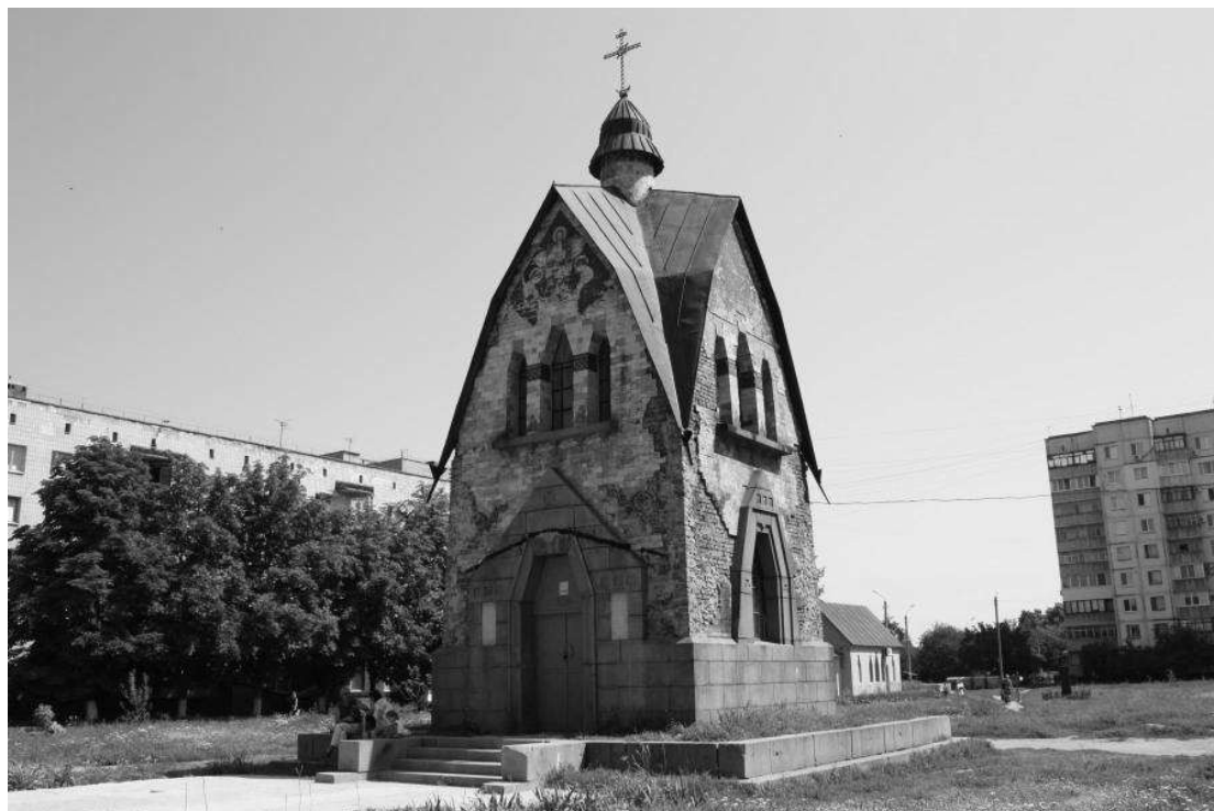
Рис. 6. Каплиця Святого великомученика Юрія Переможця [5].