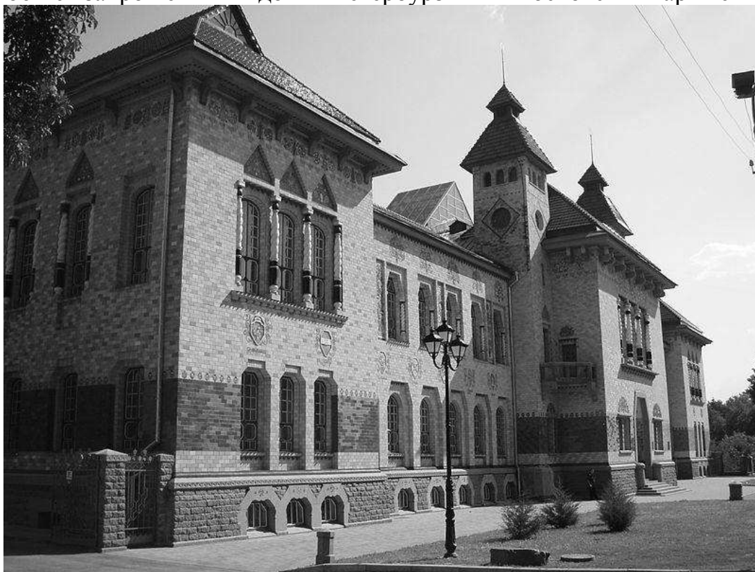
Рис. 5. Будинок Полтавського губерньського земства [5].

Стильова специфіка історичної забудови Полтави полягає в тому, що тут представлений ампір високого рівня «імператорського міста Петербурга», що пояснюється запрошенням відомих петербурзьких і московських архітекторів.