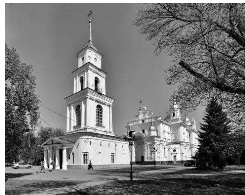
Рис. 7. Успенський собор [6]

До наших часів не збереглася полкова козацька канцелярія, яка розташовувалась на Івановій Горі.