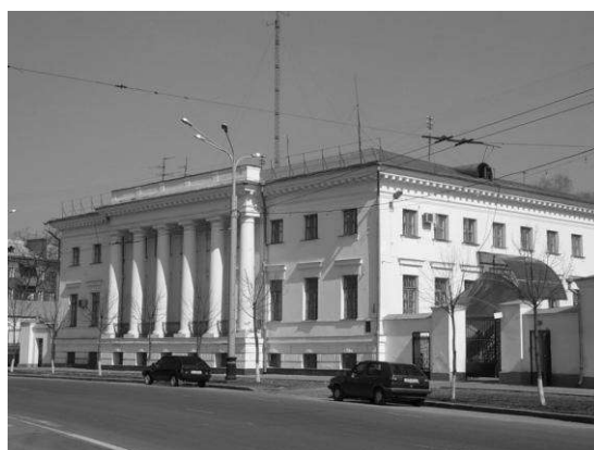
Рис. 1. Будинок генерал-губернатора [4].