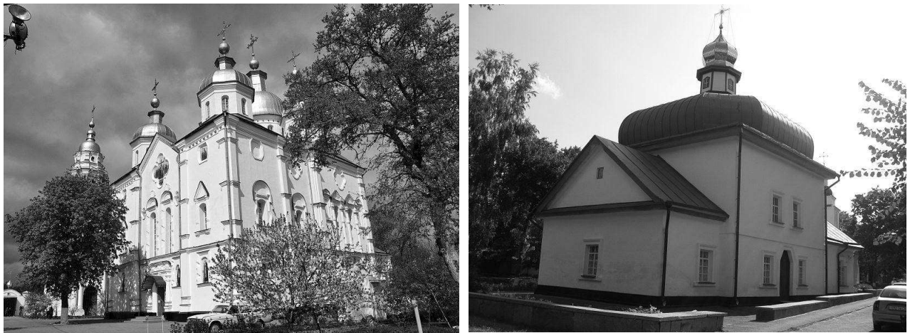
Рис. 3. Хрестовоздвиженський собор[5]. Рис. 4. Спаська церква [5].

2. Архітектура доби українського козацького (гранчастого) бароко – представлена в вигляді окремих культових споруд (комплекс Хрестовоздвиженського монастиря, Спаська церква, відтворена Успенська церква) (рис.3, 4).