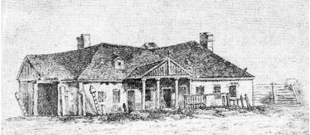
Рис.2. Стара поштова станція на Старовільській вулиці в м.Житомир

Сьогодні колишній поштовий будинок використовується як виставкове приміщення [4].