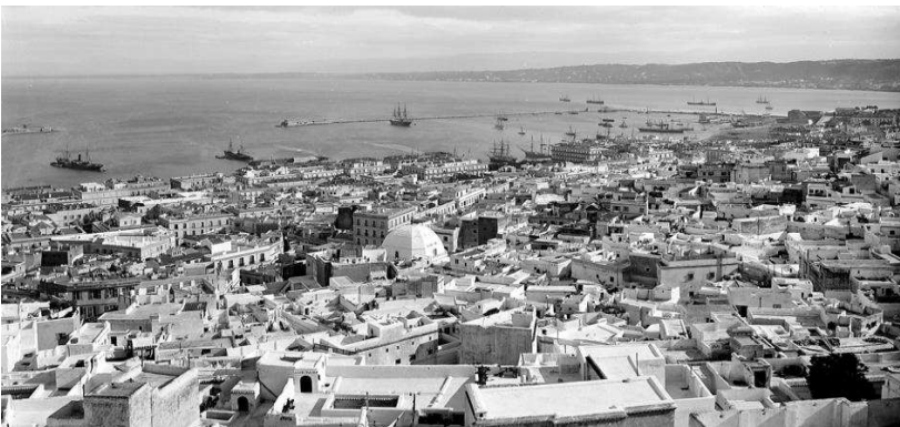
Рис. 2. Сучасна Касба.

Вулична мережа, яку французи вважали неадекватною і ірраціональною, продемонструвала чітку та функціональну ієрархію, що складається з трьох різних типів транспортних магістралей. Вулиці нижньої частині міста, призначені для комерційних, військових та адміністративних функцій, відрізняються за своїм фізичним характером і концентрацією їх діяльності: тут будувалися магазини, кафе та великі будівлі, що були переповнені людьми і товарами протягом усього дня, та особливо в ранкові години. Вулиці, що вели до воріт були особливо помітними. Поперечні дороги, які піднімалися у верхнє місто формували другу категорію: вони прорізають міську тканину так прямо, як дозволяла топографія, і створюють умови ефективної комунікації між двома частинами старого Алжиру [8]. Сусідні вулиці складають третю і найбільшу категорію. Вузькі, нерегулярні, часто з глухими кутами, вони відображають інтровертний спосіб життя, який, зосереджений навколо недоторканності житла і сім'ї; їх конфігурація також включає використання воріт, щоб закривати райони у вечірній час та забезпечити їх безпеку [8]. Повагу до приватного життя чітко диктував дизайн фасадів, : вікна і двері були ретельно розташовані так, щоб запобігти випадковим поглядам у будинки по всій вулиці.