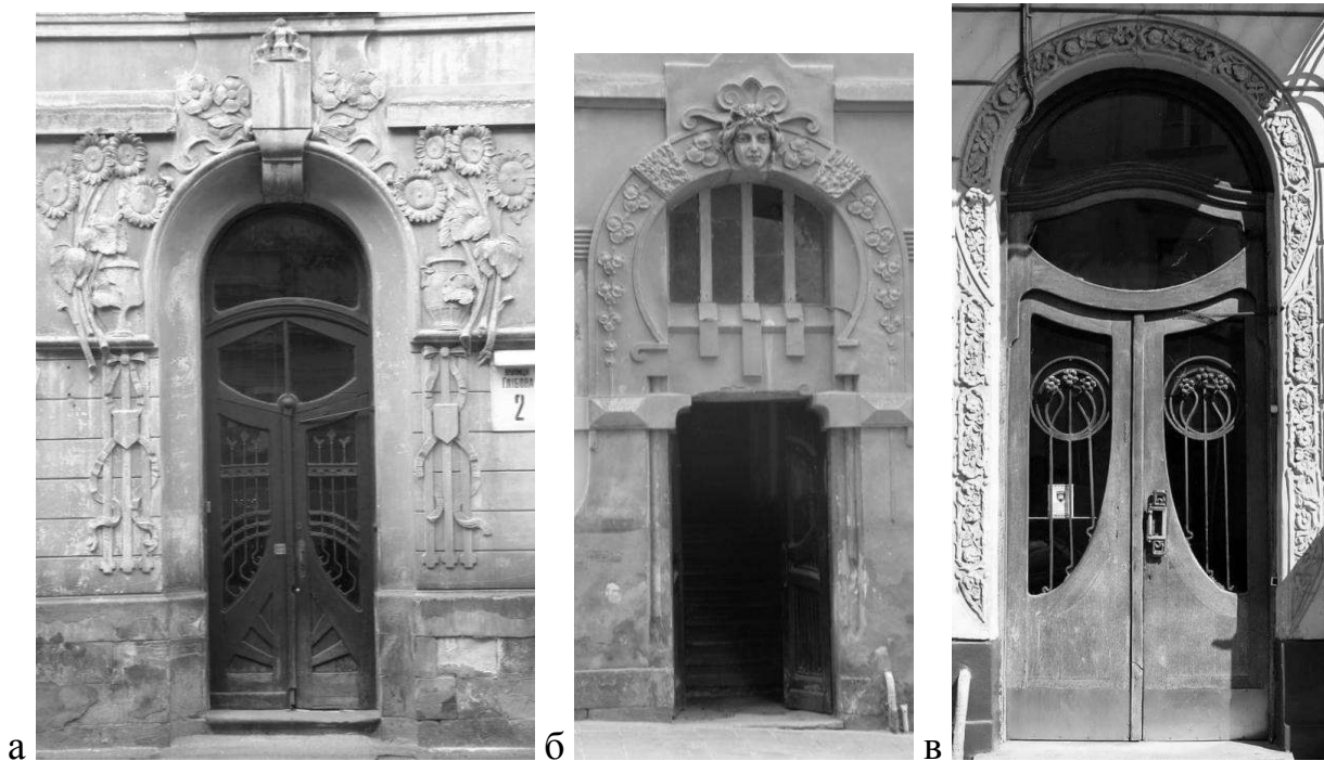
Рис. 2. Вхідні портали криволінійної та аркової форми з оформленням архівольту: а) вул. Глібова, 2, б) вул. І. Франка, 124, в) вул. пр. Шевченка, 4.