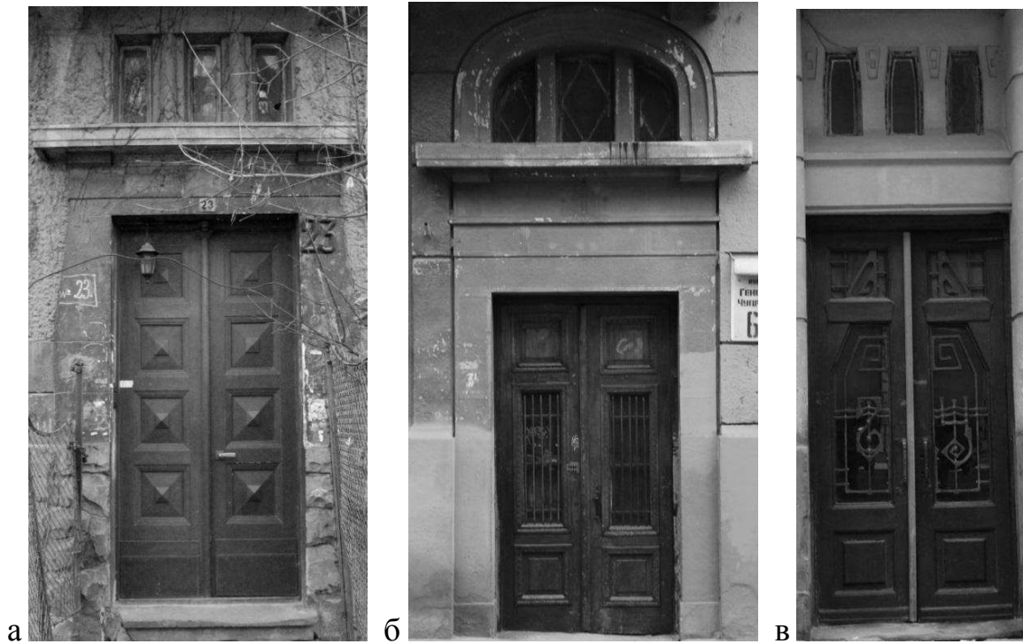
Рис. 4. Вхідні портали прямокутної форми з сандриком та світликом: а) вул. Котляревського, 23, б) вул. Ген. Чупринки, 60, в) вул. С. Бандери, 2.