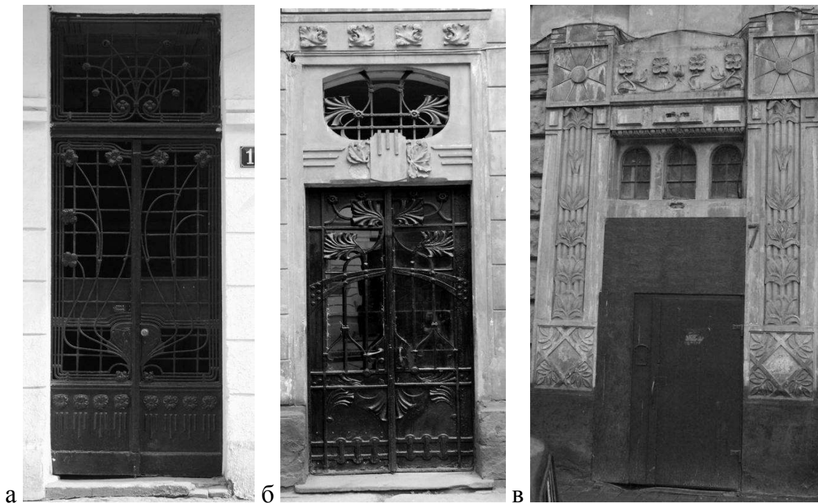
Рис. 3. Вхідні портали прямокутної форми з світликом та стилізовані пілястри: а) вул. Дорошенка, 15, б) вул. Акад. Богомольця, 6. в) будинок товариства “Дністер” вул. Руська, 20.