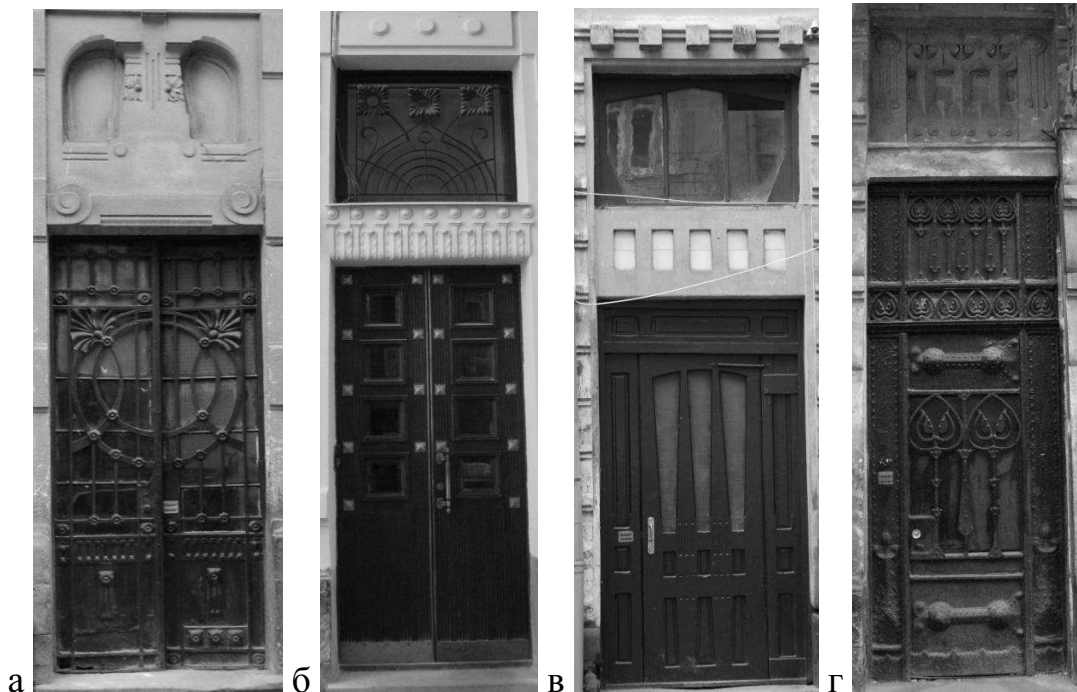
Рис. 5. Вхідні портали оздоблені волютами, колами, квадратами та майолікою: а) вул. Акад. Богомольця, 4, б) вул. Акад. Богомольця, 11, в) вул. Донцова, 12, г) вул. Богуна, 5.