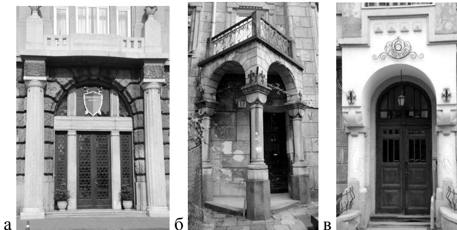
Рис. 1 Ордерні сецесійні портали, що виступають з площини фасаду як: а) неоренесансний портик (вул. пр. Шевченка, 17-19); б) просторовий

Проблеми збереження. Найпоширеніша проблема руйнації виявлена в обрамленні вхідних порталів. Пошкодження відбувається внаслідок замокання ліпних деталей (різкі перепади температури (мороз, потепління), підвищена вологість повітря негативно впливає на матеріал та призводить до руйнації; осипання, обвали ліпних елементів над вхідними порталами, а також при заміні дверей відбувається руйнація обрамлення та ліпнини (вул. Акад. Богомльця, 5) [10, с. 52]. В цілому, пошкодження ліпнини відбувається в результаті фізичного старіння декору. Окрім цього, спостерігається зміна автентичної колористики вхідних порталів (вул. Ген. Чупринки, 6); зміна членування історичного фасаду через пробивання нових отворів дверей (вул. С. Бандери, 6, вул. Хотинська, 3), а також заміна скла металевими та дерев'яними пластинами у світлику (вул. Ш. Руставелі, 44). Для того, щоб запобігти такі руйнування потрібно проводити вчасні реставраційні роботи; відслідковувати та контролювати неправомірні дії власників пам'яткоохоронними органами. Проте дослідження вхідних порталів не може обмежитися однією статтею, в подальшому має бути продовжене дослідженням особливостей полотен дверей в сецесійних будівлях.