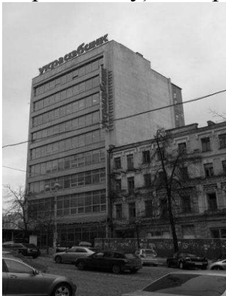
Рис. 7 Будівля Республіканського «Будинку моделей» (зараз будівля Укргазбанку), 1969 р., функціоналізм

Прикладом невдалого вторгнення в історичну забудову може також служити будівля Республіканського «Будинку моделей» Міністерства побутового обслуговування населення УРСР, побудована в 1969 році (зараз будівля Укргазбанку) за адресою вул. Вел. Васильківська, 39 (рис. 7).