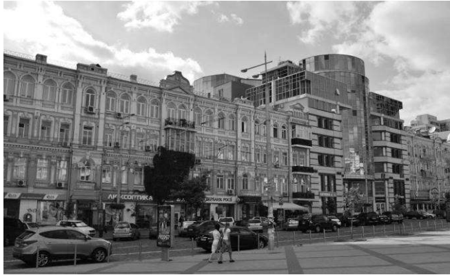
Рис. 6 Бізнес-центр «Сіті Плаза», 2003 р., арх. О. Донець

Контрастне рішення має, на жаль, і невдалі приклади. До цих випадків більш підходить слово дисонанс. Так, наприклад, масивна будівля бізнес-центру «Сіті Плаза» з досить грубим фасадом зі скла і бетону по вул. Вел. Васильківська 62/64 неделікатно розриває ряд витончених історичних фасадів у стилі неоренесанс, створюючи враження деякої зневаги до історичного минулого тільки підкреслюючи її чужорідність. (Див. рис. 6)