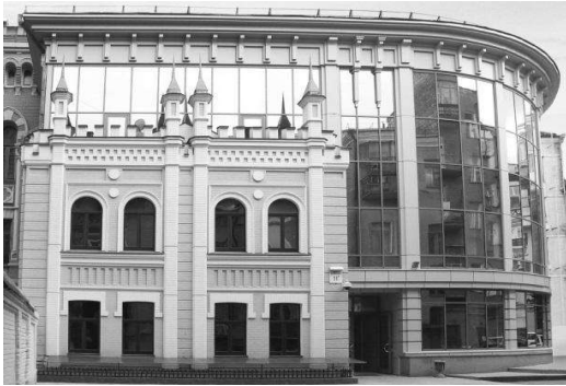
Рис. 5 Адміністративна будівля, 2013 р., гол. арх. О. Коваль

Контрастне рішення має, на жаль, і невдалі приклади. До цих випадків більш підходить слово дисонанс. Так, наприклад, масивна будівля бізнес-центру «Сіті Плаза» з досить грубим фасадом зі скла і бетону по вул. Вел. Васильківська 62/64 неделікатно розриває ряд витончених історичних фасадів у стилі неоренесанс, створюючи враження деякої зневаги до історичного минулого тільки підкреслюючи її чужорідність. (Див. рис. 6)