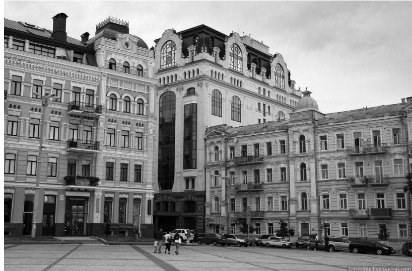
Рис. 1 Адміністративна будівля, 2010 р., Архітектурне бюро «Смирнов і К°»

Ще одним вдалим прикладом є будівля офісно-торговельного центру на вул. Верхній Вал 68, виконана за проектом Архітектурного бюро «О. Коваль» (у складі ВАТ «Київпроект»). (Див. рис. 2)