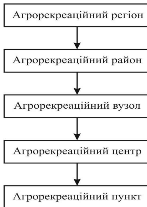
Рис. 2. Рівні агрорекреаційних утворень

5) агрорекреаційний регіон – це велика природно-етнокультурно-адміністративна територіальна одиниця, до якої можуть входити від однієї до кількох адміністративних областей, що характеризуються подібністю рис природно-ландшафтної будови, історико-культурного і соціально-економічного розвитку, традицій агрокультури, визначеними інфраструктурними зв'язками та іншими факторами [4].