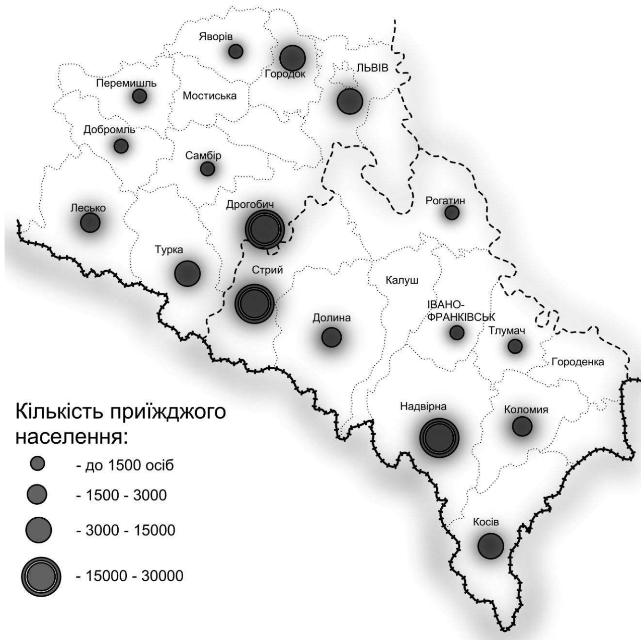
Рис. 1. Схема розміщення рекреаційних територій та чисельності відвідувачів у Івано-франківській та Львівській обл. (За С. Лецицьким [18] )

військової промисловості та армії. У зв'язку з окупацією території України (Східної Галичини у т. ч.) всі науково-дослідні топографо-картографічні роботи припинились, гідрометеослужба була повністю воєнізованою, забезпечувала бойові частини необхідною природничою інформацією та прогнозами. Створювалися детальні описи метеорологічних прогнозів, водних об'єктів на час наступальних операцій [16].