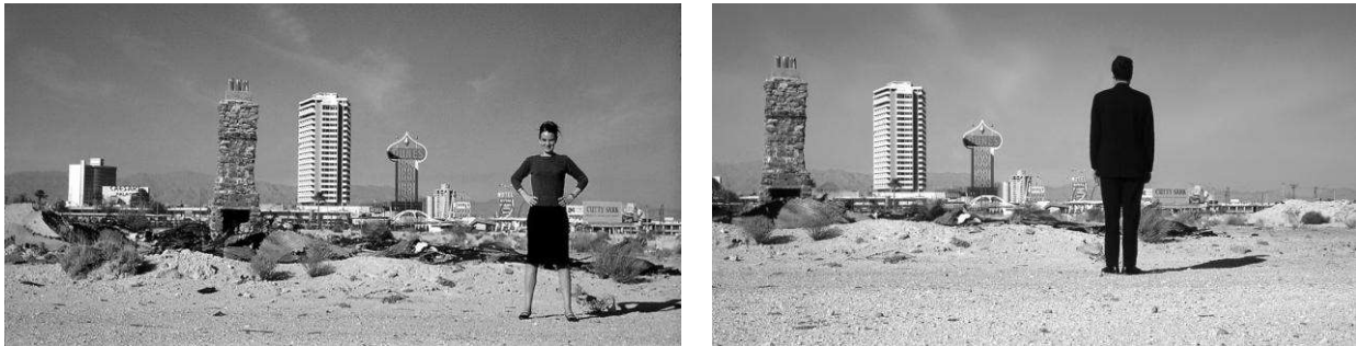
Рис. 1. Деніз Скотт Браун та Роберт Вентурі, Лас-Вегас, 1960-ті рр..

Особистим внеском до книги Д. С. Браун, про який вона зазначила у передмові редактованого видання, стала “десексуалізація” тексту, що була свого часу продиктована усвідомленням стану проблеми “гендерної” нерівності [9, с. 32]. Не менш важливим є соціальний контекст, адже, за словами авторки, архітектори роблять занадто багато, забуваючи про соціальні наслідки своїх дій: “Ми говоримо їм: «будьте скромніше, робіть менше»” [4, с. 94].