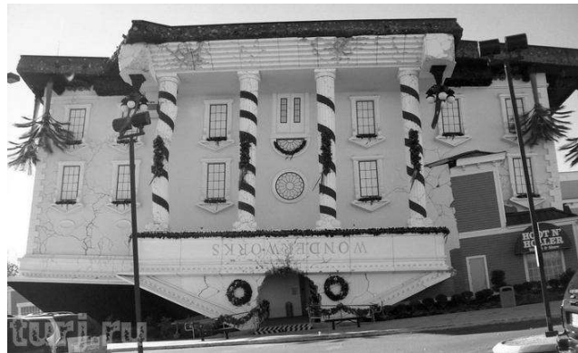
Перевернутий будинок в Орландо (символізм)