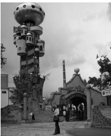
Пивна вежа Хундертвассера (декоративізм)