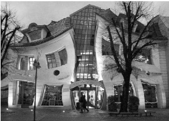
Кривий будинок в Польщі (декоративізм)