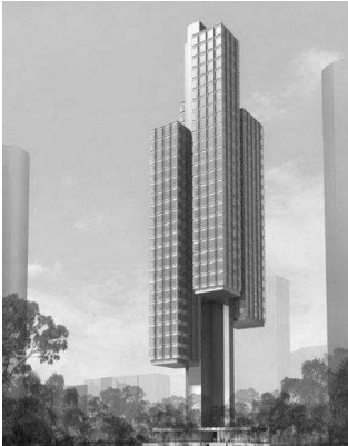
Башня в Сінгапурі («danger» архітектура)