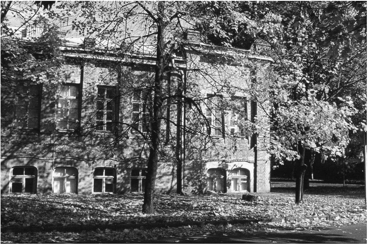
Рис.1. Загальний вигляд будинку в 1980-х рр.

влаштування підлог з дошок, отиньковувались стіни і вкривався залізом дах.