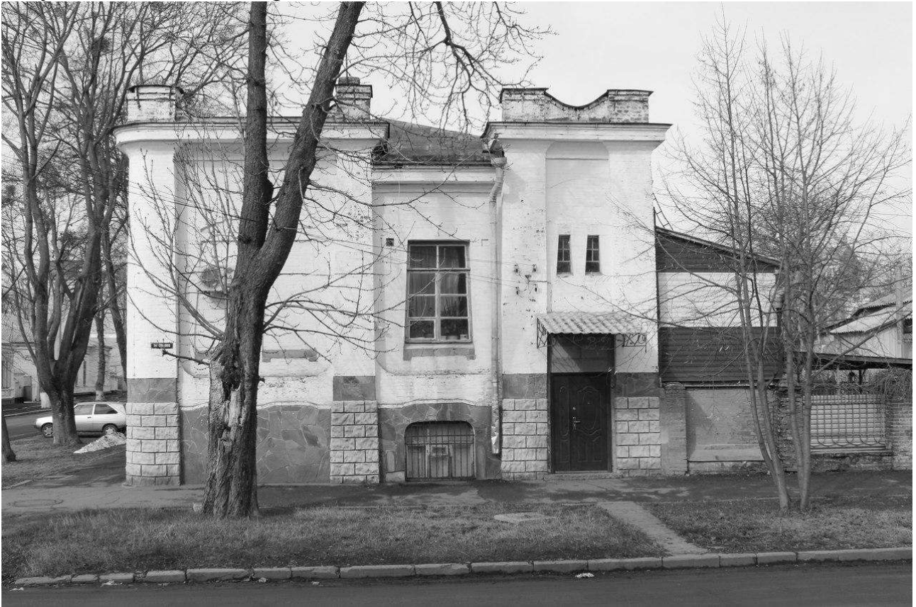
Рис.2. Сучасний стан фасаду будинку по вул. Садовій.

емігрував і був похований в 1961 році на Ольшанському цвинтарі в Празі. Після Китаю певний час міг будувати в Полтаві, проте ця версія вимагає документального підтвердження.