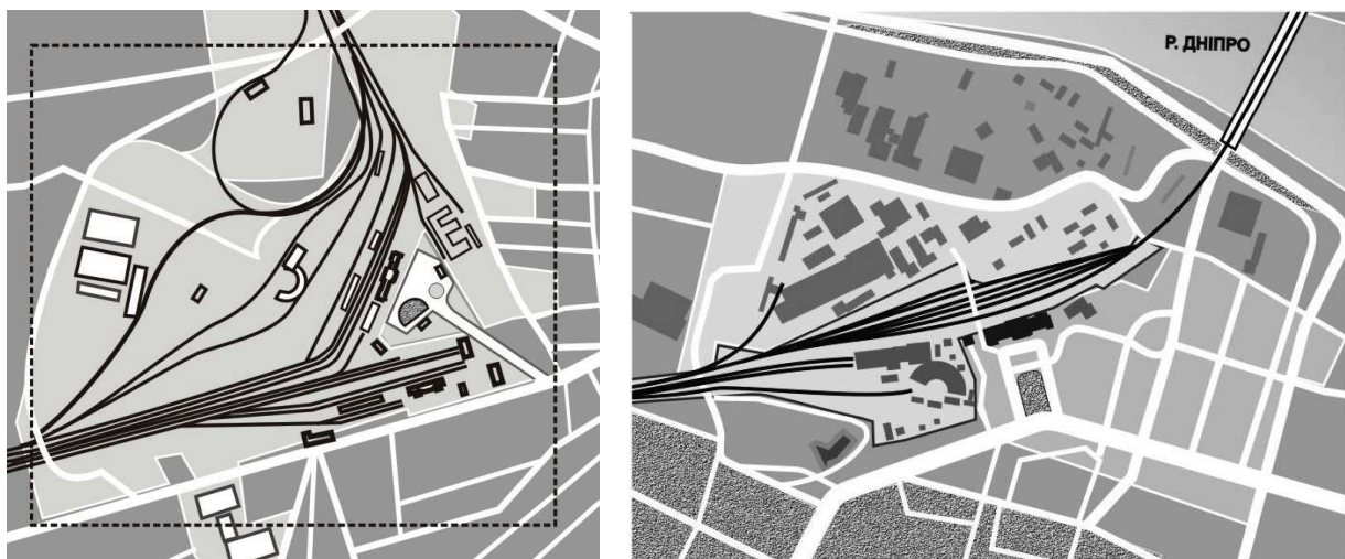
Рис. 1. Технічні, сортувальні та вантажні станції поруч з пасажирськими станціями центральних залізничних вокзалів міст Львів та Дніпропетровськ формують цілісні територіальні комплекси.

Так, в м. Донецьк поруч з шістьма пасажирськими платформами станції центрального залізничного вокзалу функціонує вантажна станція, що перевищує пасажирську в декілька разів. В м. Харкові поруч з пасажирською станцією Південного залізничного вокзалу значну територію теж займають технічна і сортувальна станція.