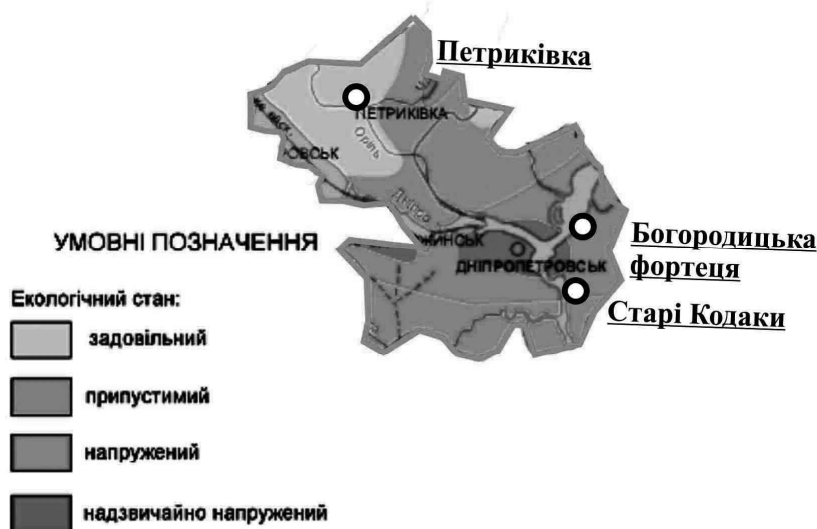
Рисунок 2 – Сучасний екологічний стан туристично-рекреаційної зони

Туристично-рекреаційна зона включає такі території, на півдні регіонального центру, на крутому яружному березі Дніпра лежить село Старі Кодаки, та на південний захід від Дніпропетровська розташоване село Шевченко, у північно-західній частині області поряд з Дніпропетровським районом межує Петриківський район. Заповідні урочища, пам'ятки природи на місцях де є залишки фортеці Кодак є одним з найпопулярніших місць Дніпропетровщини, де відчувається особлива атмосфера древньої козацької епохи. У 1940 році на території фортеці було закладено гранітний кар'єр і до 1994 року він знищив близько 90% Кодака. Сьогодні земляні вали в районі сучасного селища Шевченко, які знаходяться в межах міста Дніпропетровська, виглядають спокійними і умиротвореними, цікаво пройти по цих історичних місцях колишньої «Богородицької фортеці».