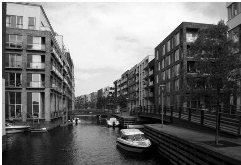
Рисунок 2. Sluseholmen і Tegllholmen. район Копенгагена