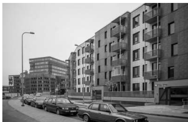
Рисунок 5. Житлові будинки в районі «Ozo parkas». Вільнюс. Литва