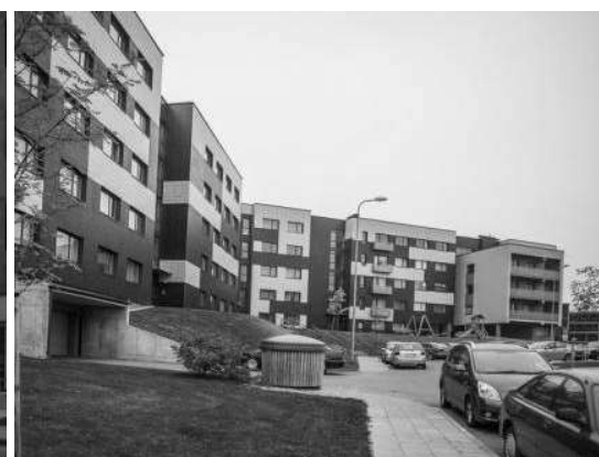
Рисунок 6. Паркінг під житловими будинками