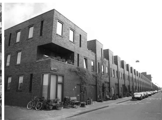
Рисунок 4. Таунхауси в Борнео Споренбург