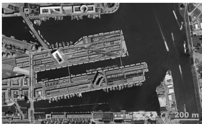
Рисунок 3. Місце розташування району Борнео-Споренбург. Амстердам