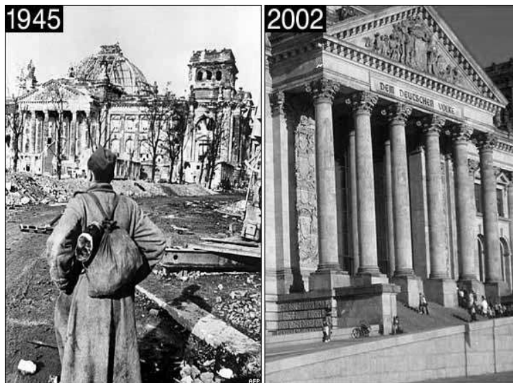
Рис 1. Фото рейхстагу м. Берлін під час бомбардування 1945 р. і після відбудови

Виклад основного матеріалу. Відновлення зруйнованих європейських міст після другої світової війни відбувалося в певній хронологічній послідовності.