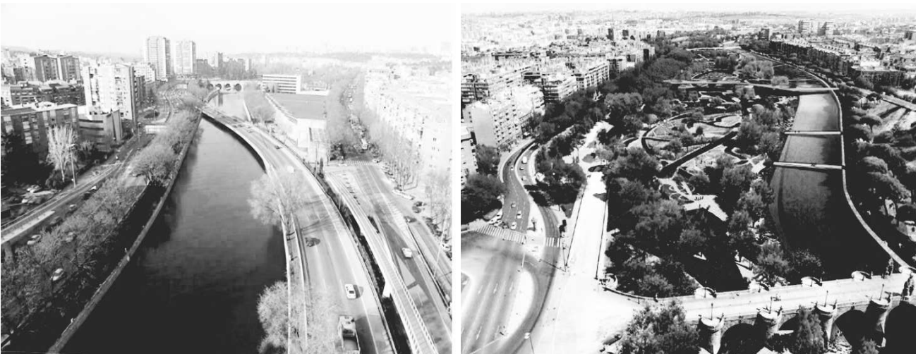
Рис. 1. Madrid RIO до та після реконструкції [13].