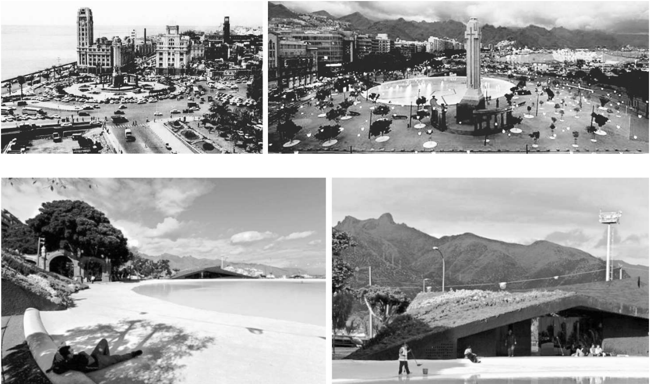
Рис. 3. Площа Іспанії у м. Santa Cruz de Tenerife: до та після реконструкції [15; 16].

Слід відмітити, що практично всі проаналізовані нами проекти спрямовані на компенсацію територій, тобто повернення мешканцям міських просторів, раніше зайнятих під технічну інфраструктуру. Це також включає збалансований розвиток пішохідного, велосипедного і транспортного руху з перевагою пішохідного руху [17]. По-друге, простежується використання одного композиційного стилю, який зараз отримав назву ландшафтний модернізм (або мінімалізм). Стиль відрізняється правильною геометричністю в організації планування і просторів, лаконізмом композиційних засобів та великим планувальним масштабом. Цей стиль найбільш характерно відображається в роботах Марти Шварц: Vanke Center у Китаї, Marina Linear Park та Nouvelle at Natick у США, Monte Laa Central Park в Австрії.