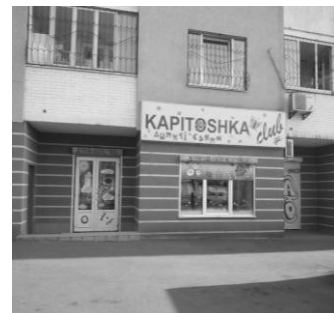
Дитячий клуб «Капітошка»