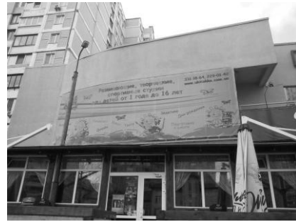
Клуб дитячої творчості «Ухтишка»