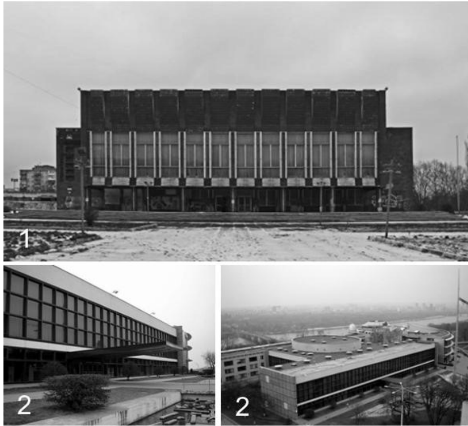
Рис. 1. 1 - Палац культури ім. Королева; 2- Київський Палац дітей та юнацтва.

У радянському минулому України система позашкільної освіти була сформована і чітко структурована за чисельністю учнів, типам і профілів установ, характерам дозвілля і т.д. і охоплювала всю соціальну сферу суспільства. [2].