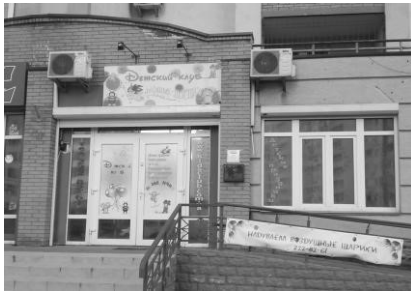
Дитячий клуб «Свято дитинства»

установ вдаються до «дешевих» методів реклами, яка аж ніяк не підпорядковується з місцевістю (рис. 2).