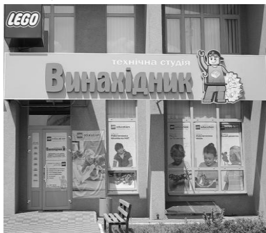
Технічна студія «Винахідник»